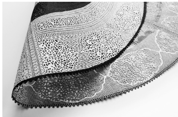
Myriam Dion, Smog shrouding the India Gate war memorial in New Delhi, November , The New York Times (détail), 2019. Papiers journaux (datant de 2018 et de 1920) coupés au couteau x-acto, collage de papier japonais et feuille d'or, 91 × 91 cm.