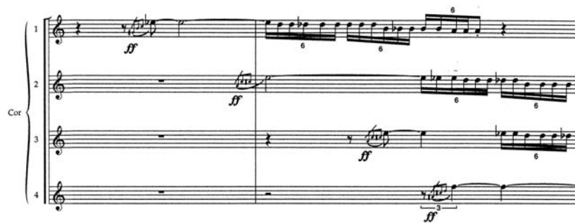
FIGURE 2 Quaternions , 3 e mouvement, Tableau IX : Valère, p. 77, mes. 222-223 (cors)

On retrouvera ainsi chez Longtin de nombreux gestes de cynisme, tout particulièrement en réaction à des passages modaux; parmi eux, on reconnaîtra une figure typique d'accompagnement de Ländler 20 dans ... et j'ai repris la route 21 , lorsque les flûtes, moqueuses, tentent de couvrir le retour d'un thème de cornemuse écossaise aux clarinettes.