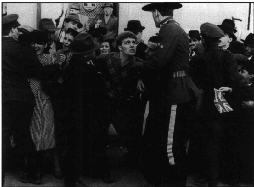
Les Plouffe de Gilles Carle (1981)

Par exemple, le film Les Plouffe (1981) de Gilles Carle, adapté du roman de Roger Lemelin (1948) et scénarisé par les deux auteurs, repose fondamentalement sur le thème de la famille canadienne française des années 30 et 40, mise en relation avec la société de l'époque et ses institutions, de même que ses valeurs. C'est ainsi que l'Église, la religion, la morale et le pouvoir deviennent des sous-thèmes qui se greffent au thème central de la famille. Enfin, thèmes et sous-thèmes sont pris en charge par une galerie de personnages principaux et secondaires et un ensemble de situations qui les illustrent jusqu'à leur actualisation, considérée complète au moment du dénouement de l'his-