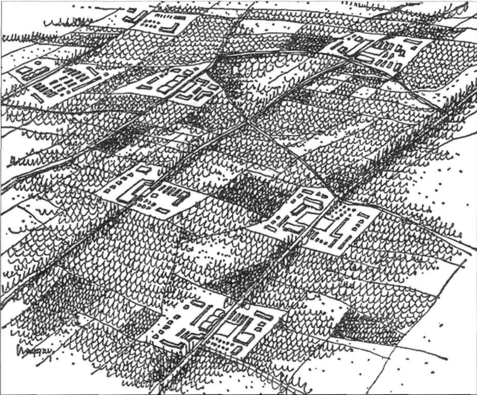
Figure 3 « Une zone unique. Paysage partout présent. Dispersion parfaite »

Source : E. A. Gutkind, The Twilight of Cities , Free Press of Glencoe, 1962 (éd. française, Stock, 1966)