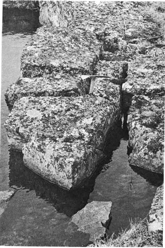
Photo 3 Blocs détachés probablement par le gel sur le bord d'une mare du carré Roc. Le piolet, enfoncé dans une fissure, donne l'échelle.

Il n'en est pas de même du dôme aplati central ; là se trouve en effet la plupart des mares et des flaques; celles-ci sont surtout inscrites à même la roche en place et une végétation plus fournie ne parvient pas toujours à entourer les plus petites d'entre elles. Les jours de grand vent ou d'ensoleillement, les flaques perdent leurs eaux, et parfois totalement, nous l'avons vu. Quant à la pente rocheuse d'ensemble, elle est partout faible en dehors des petits abrupts locaux orientés suivant des plans de fracture.