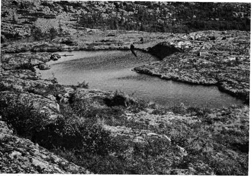
Photo 2 Le laquet, dans la partie sud-est du carré Roc, est la nappe d'eau la plus importante de ce carré.

sur le bord du petit lac, des mares et des flaques, au-dessus du niveau actuel de l'eau (vers le 15 août) d'une frange de roche nue ou presque de 1 à 12 centimètres (0,4 à 5 pouces) de haut (tableaux 3 et 4, colonne « Variation du niveau »). Il est très possible que certaines dépressions formées du roc, observées à sec le 12 août, aient porté des flaques à la fonte des neiges, et que des flaques mesurant moins d'un mètre le 12 août, aient été précédemment plus étendues.