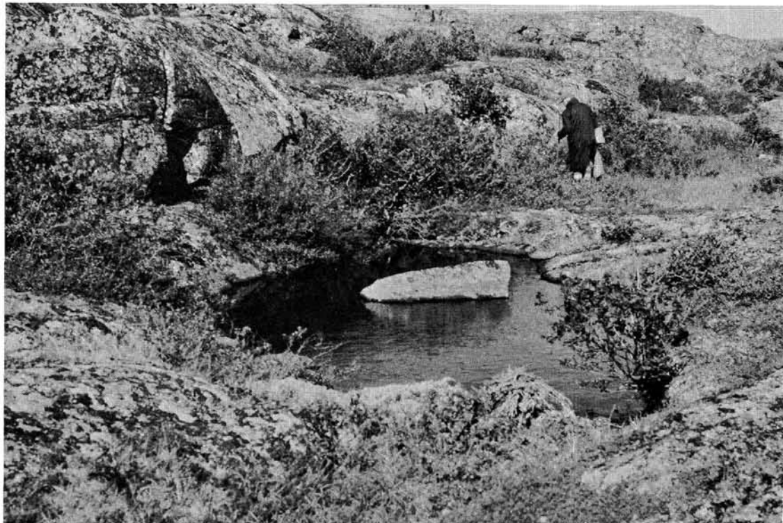
Photo 4 Aspect typique de la façade sud : abrupt entaillant le dôme aplati central (en baut). À son pied, cavité, arbrisseaux et mare Mi.

La façade sud est constituée de deux parties totalement différentes topographiquement mais complémentaires au plan climatique. D'abord l'abrupt principal de toute la colline, abrupt souvent décomposé en estrades; ainsi, l'amplitude topographique de 25 à 67 mètres (83 à 220 pieds) comprend une série de sections verticales