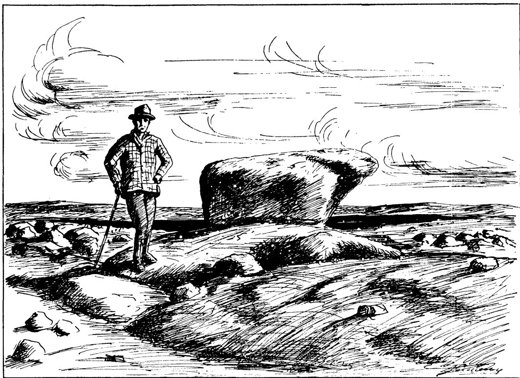
FIGURE IV MONUMENT DE TYPE « Fa »

(dessin Jacques Lemieux d'après photo Louis-Edm. Hamelin)