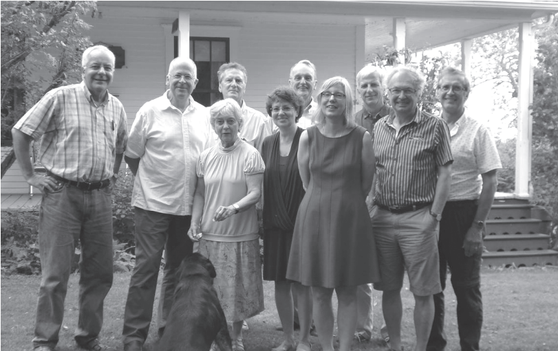
Les Dix réunis à Saint-Jean-de-Brébeuf en août 2015.

Le 18 août 2015, les Dix se sont réunis à Saint-Jean-de-Brébeuf dans les Appalaches. Ce fut l'occasion notamment d'accueillir Andrée Fortin au deuxième fauteuil et de visiter le remarquable Musée du bronze à Inverness.