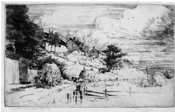
Herbert Raine, Charettes à foin sur la route Saint-Joachim , vers 1917-19, eau-forte et pointe sèche sur papier vélin, 12,2 x 20,2 cm (planche), Musée des beaux-arts du Canada (36890).