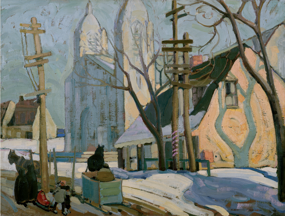
Albert H. Robinson, Noon-time, Longue-Pointe Village , 1919, huile sur toile, 76,7 x 101,8 cm, Musée national des beaux-arts du Québec (34.567).

Après-midi d'avril est une œuvre magistrale de Suzor-Coté et le jury profite de l'occasion pour acquérir l'une de ses plus importantes réalisations 38 . En s'inspirant d'un détail de la nature, un cours d'eau bordé d'arbres au moment du dégel, l'artiste offre une superbe leçon de lumière et de couleurs alors que les subtils empâtements accentuent les effets lumineux.