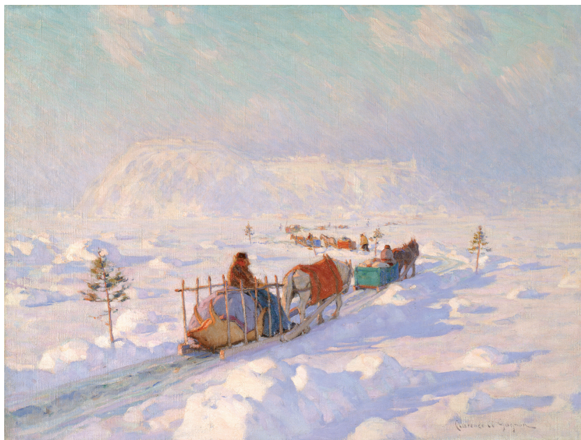
Clarence Gagnon, Peasants Crossing on Ice Bridge, Quebec ou Le Pont de glace à Québec , n.d., huile sur toile, 56,4 x 74,5 cm, Musée national des beaux-arts du Québec (34.636).

les œuvres de Barnsley et de Brymner, il s'agit d'un paysage générique qui représente ici la nature sauvage des Laurentides 47 , et rallie tous les suffrages 48 .