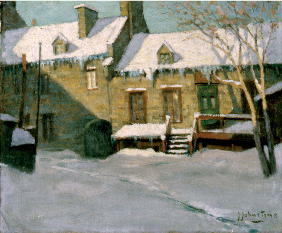
John Young Johnstone, Old Courtyard, St. Vincent Street , n.d., huile sur toile, 50,3 x 61 cm, Musée national des beaux-arts du Québec (34.250).

Avec une scène de marché de la place Jacques Cartier, Alice des Clayes 40 renforce cette idée de la rencontre de la ville et de la campagne à partir d'un vocabulaire pictural qui emprunte au postimpressionnisme. Un dessin libre, une palette claire guidée par un pinceau aux touches évidentes créent une scène dynamique. Alors que l'artiste se concentre surtout sur les chevaux au repos, la facture fournit l'impression de mouvement. L'hôtel de ville et la colonne Nelson confirment l'évidence du lieu et de la scène familière que savent reconnaître tous les Montréalais.