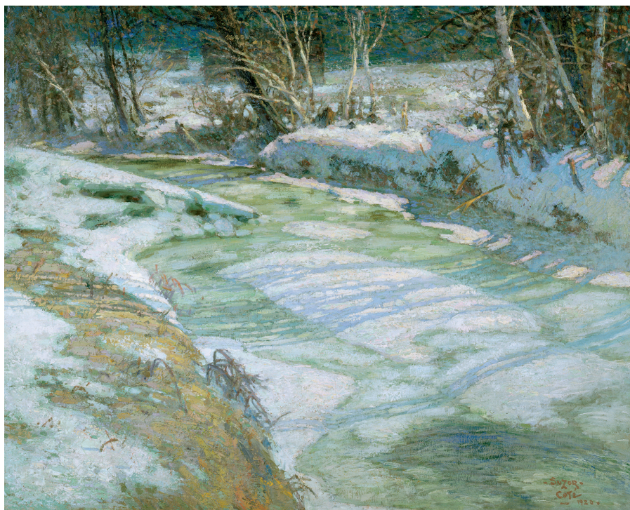
Marc-Aurèle de Foy Suzor-Coté, Après-midi d'avril , 1920, huile sur toile, 80,8 x 100,7 cm, Musée national des beaux-arts du Québec (34.591).

À l'exposition du printemps, le jury a eu la main heureuse. La sélection est dominée par trois tableaux qui représentent chacune un temps fort de la carrière de Suzor-Coté, Robinson et des Clays. Les œuvres de Johnstone et Raine sont également intéressantes, mais elles offrent moins d'originalité en regard des autres œuvres retenues.