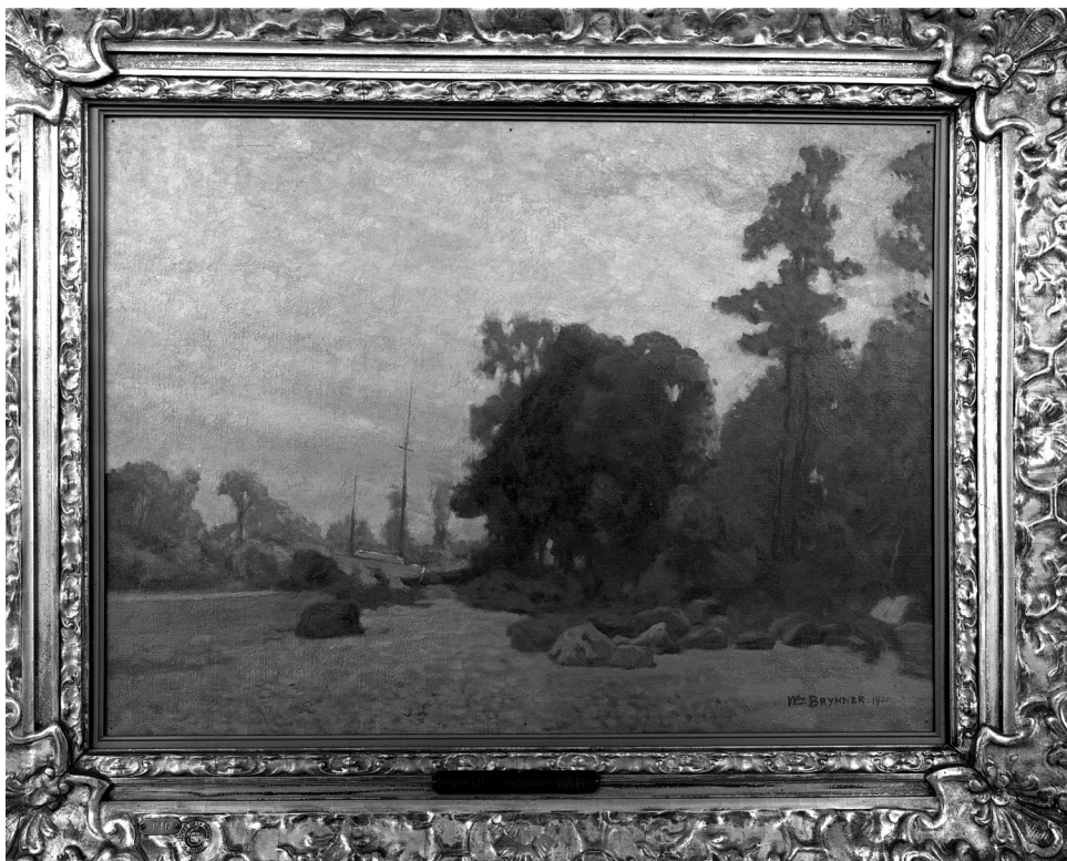
William Brymner, Evening Light, Portneuf, Quebec , aussi connu comme Paysage au bord de l'eau ou À la brunante, Portneuf , n.d., huile sur toile, 53,3 x 72,4 cm, œuvre détruite en 1966 (P-46). Photo : BAnQ (Québec), photo Neuville Bazin, 1950, E6,S7,SS1,P82246.

De Clarence Gagnon, le comité choisit Peasants Crossing on Ice Bridge, Quebec , retiré Le Pont de glace, Québec 49 . Il s'agit d'une magnifique étude de tonalités de bleu, de rose et de turquoise formant une suite sinueuse de traîneaux se dirigeant vers Québec par une journée d'hiver ensoleillée. Le Cap Diamant et la citadelle (un symbole fort pour les Québécois) dominent l'espace et sont traités comme le ciel au moyen de longues diagonales qui alternent entre le blanc et le bleu clair. Les taches orange et rouge ajoutent des notes stridentes à cette étude de lumière éblouissante.