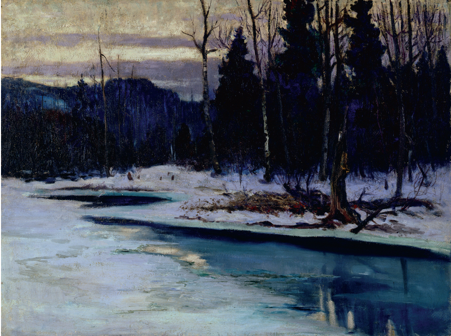
Maurice Cullen, Spring ou Le Printemps, rivière Caché , n.d., huile sur toile, 61,7 x 82,2 cm, Musée national des beaux-arts du Québec (34.115).

De l'architecte et graveur Herbert Raine on choisit deux estampes : On the St. Joachim Road et Haycarts on the St. Joachim Road 43 . Leur coût peu élevé a sans doute plaidé en faveur de l'acquisition de ces deux gravures, une technique qui connaît alors un renouveau au Canada, mouvement auquel participe activement l'artiste 44 . Qui plus est, Raine s'inspire de paysages de la Côte-de-Beaupré, un lieu privilégié par les peintres depuis le tournant du siècle et que Brymner, Cullen et Morrice ont rendu célèbre tout en les associant à une certaine modernité artistique 45 .