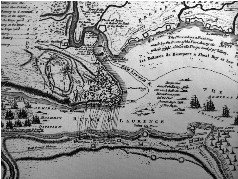
Plan du Saint-Laurent avec les opérations du Siège de Québec (détail). Paru dans Thomas Jefferys, The Natural and Civil History of the French Dominions , 1760.