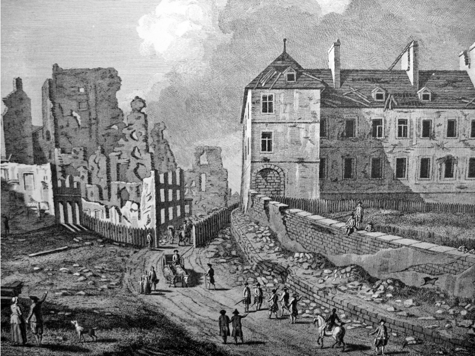
Vue du Palais épiscopal et de ses ruines à Québec (détail). Gravure d'A. Benoist d'après un dessin de Richard Short. Édité par Thomas Jefferys à Londres, 1761.

Depuis 8 heures du soir jusqu'à 6 heures du matin ce jourd'huy, les ennemis nous ont envoyé 230 bombes comptées, ainsy qu'une grande quantité de boulets ; c'est d'usage que quand ils souffrent à la campagne ils se vengent sur la ville 81 .