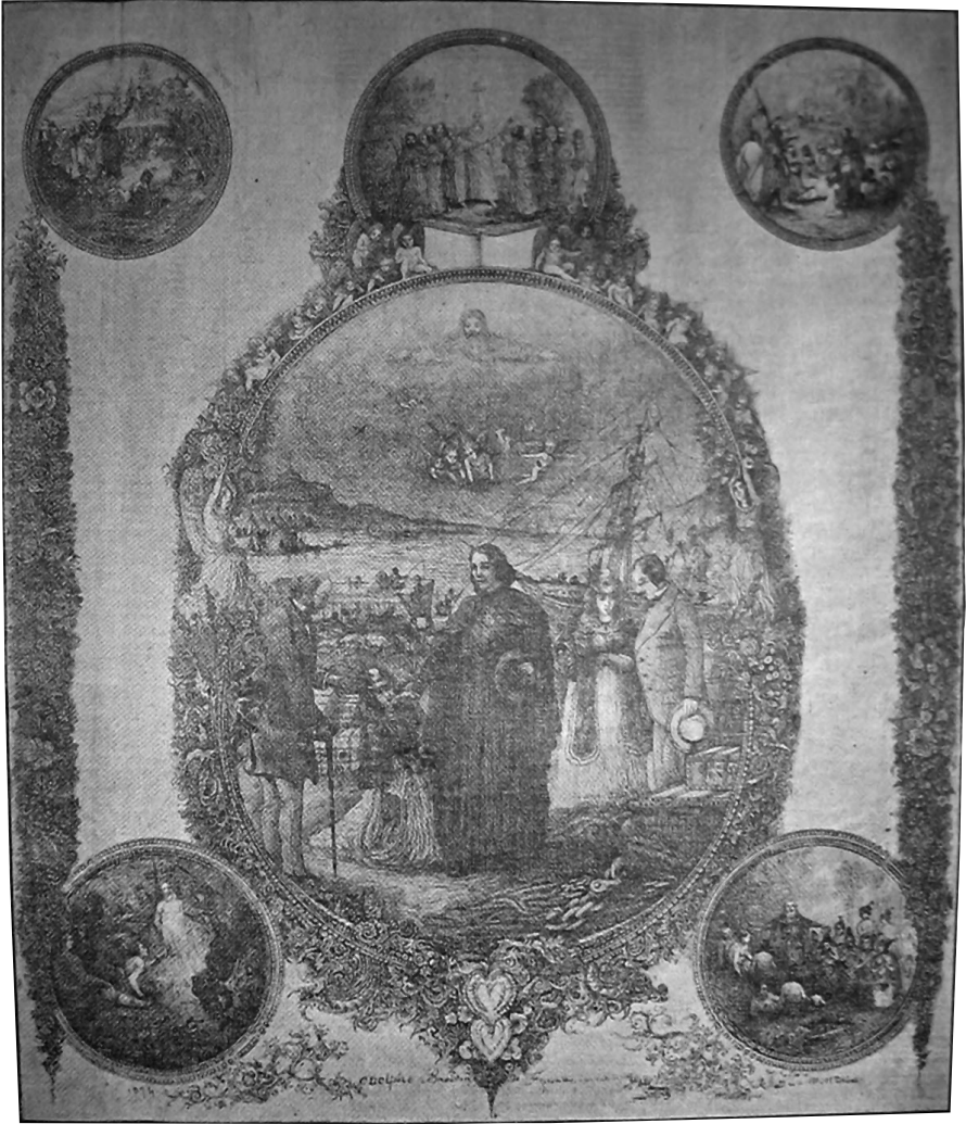
La Prédication apostolique dans les différentes parties du monde , 1874, lithographie reproduite dans La Presse , 28 octobre 1905, p. 5.