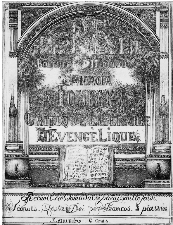
Le Réveil du Canada , non daté, lithographie, 22,8 x 17,4 cm, Rijksprentenkabinet, Rijksmuseum.

de Breskin en matière d'orthographe. L'encrage irrégulier de la pierre rend cette image encore plus difficile à lire. Les lettres du titre sont décorées et placées sur un fonds de feuillage très dense qui s'interrompt au niveau du mot Évangélique . Le tout est entouré d'un cadre formé de pilastres sur les côtés et d'un arc à la partie supérieure. Les pilastres, ornés de bougies placées sur des glands, reposent