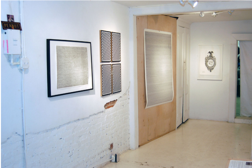
Figure 5. Peanut Underground, exposition personnelle, 2014