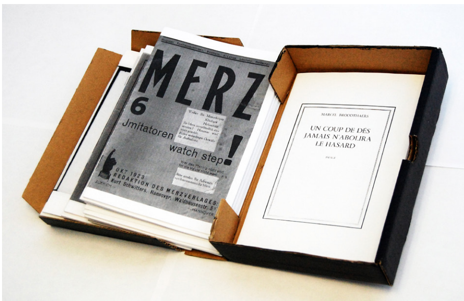
Figure 4. Boîte Pirate, Schwitters et Broodthaers, 2010

Un coup de dés jamais n'abolira le hasard est à l'origine un poème de Stéphane Mallarmé publié dans une revue littéraire à la fin du XIX e siècle peu avant sa mort. Quinze années plus tard, au début de la Première Guerre mondiale, le poème fut enfin publié comme il le souhaitait, sous la forme d'une publication autonome, dans un livre dont il a imaginé la mise en page avec un imprimeur, avec une composition typographique qui fait partie du poème. Dans cette publication dont la mise en page évoque une mer déchaînée, le blanc du papier est aussi important pour le poète que le noir du texte imprimé. C'est pourquoi, cinquante ans plus tard, Marcel Broodthaers procédait à une appropriation iconoclaste en caviardant tout le texte avec des barres noires, révélant ainsi le rythme intérieur du texte original. C'est l'un des livres d'artistes les plus importants et les plus rares du XX e siècle et ce type me tendait sa carte de visite en me disant simplement: « Tu devrais venir chez moi et je te montrerai un exemplaire. »