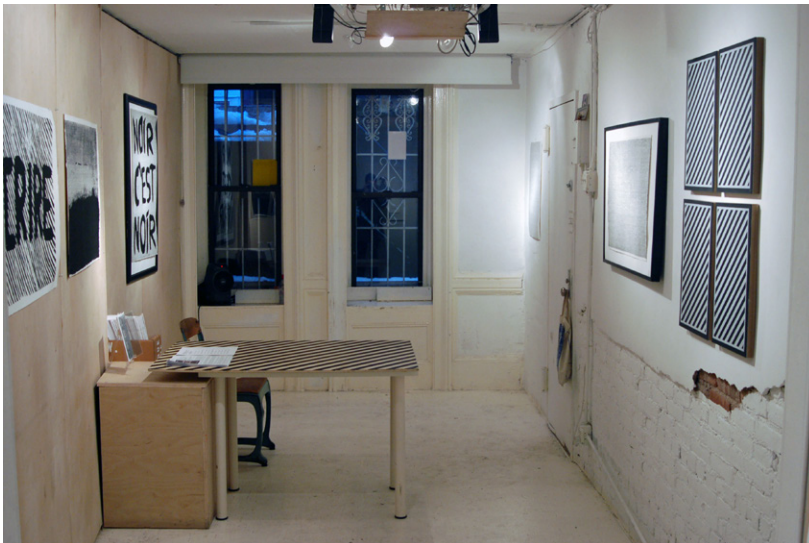
Figure 6. Peanut Underground, exposition personnelle, 2014

Je n'avais jamais été dans un tel appartement. Au 43 e étage de l'Upper West Side, je pouvais voir presque tout Manhattan, alors même que les stores étaient baissés pour protéger ses livres de la lumière du soleil. Nous nous sommes assis dans son bureau et j'ai regardé tout autour de moi, émerveillé. J'étais entouré de l'ensemble des chefs-d'œuvre dont parlent tous les ouvrages à propos des livres d'artistes que je venais de lire pour ma thèse, et dont la plupart ne peuvent être consultés que dans les bibliothèques des musées. Il me montrait des classeurs de Carl Andre, un scrapbook de William Burroughs ; même la table basse en miroir sur laquelle nous posions ces merveilles était une œuvre unique réalisée pour lui par Terence Koh. Il semblait posséder tous les livres d'artistes de Marcel Broodthaers et me sortit un exemplaire du célèbre Coup de dés . Je lui avais apporté un exemplaire de chaque publication que j'avais faite et il voulait toutes les acheter. Il m'a alors dit quelque chose qui m'a surpris « Antoine, j'ai lu ta thèse. » « En français? », j'ai demandé. « Oui, et je suis très intéressé par ce que tu développes sur les zines réalisés par des artistes. J'aimerais que tu continues cette recherche et éventuellement que tu