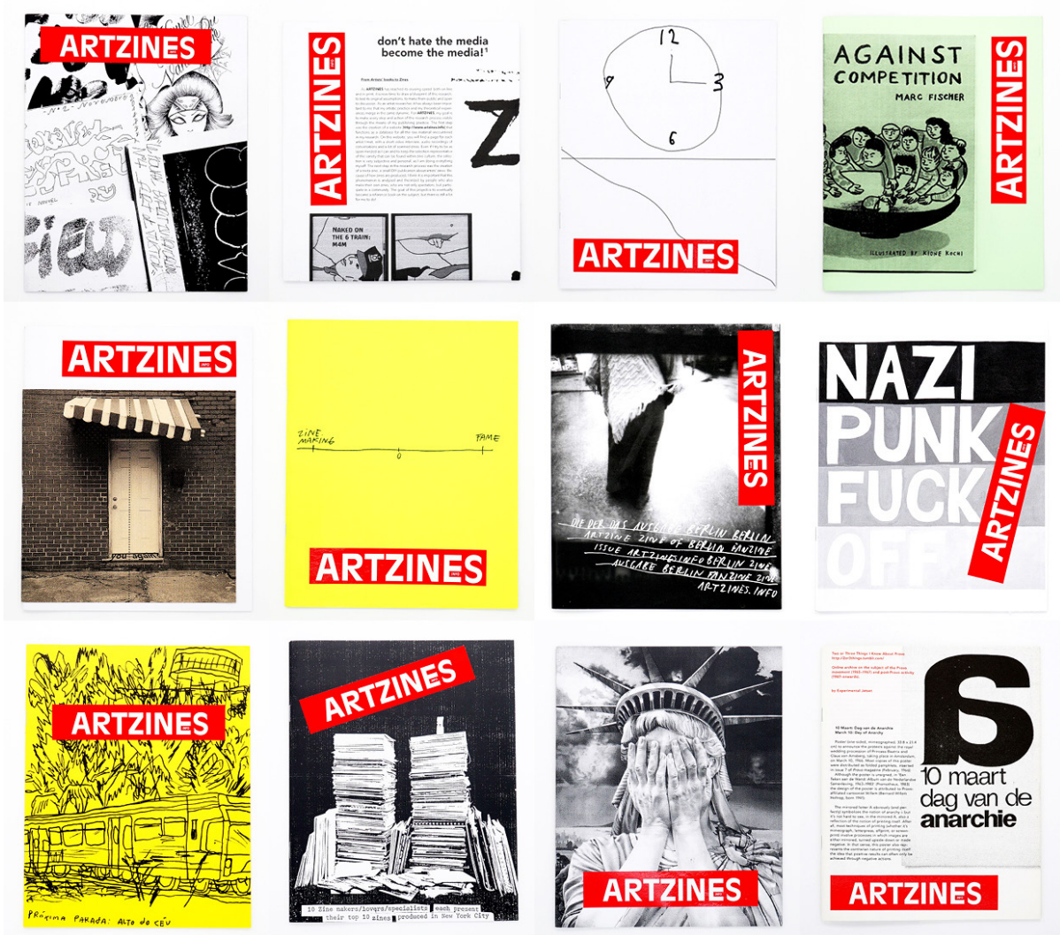
Figure 7. ARTZINES 1 à 12, 2016-2018

Malheureusement, en 2018, à la suite de problèmes personnels, mon mystérieux bienfaiteur décida de mettre fin à son soutien et à notre collaboration, laissant le projet inachevé.