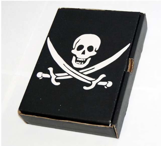
Figure 3. Boîte pirate, 2010

Un coup de dés jamais n'abolira le hasard est à l'origine un poème de Stéphane Mallarmé publié dans une revue littéraire à la fin du XIX e siècle peu avant sa mort. Quinze années plus tard, au début de la Première Guerre mondiale, le poème fut enfin publié comme il le souhaitait, sous la forme d'une publication autonome, dans un livre dont il a imaginé la mise en page avec un imprimeur, avec une composition typographique qui fait partie du poème. Dans cette publication dont la mise en page évoque une mer déchaînée, le blanc du papier est aussi important pour le poète que le noir du texte imprimé. C'est pourquoi, cinquante ans plus tard, Marcel Broodthaers procédait à une appropriation iconoclaste en caviardant tout le texte avec des barres noires, révélant ainsi le rythme intérieur du texte original. C'est l'un des livres d'artistes les plus importants et les plus rares du XX e siècle et ce type me tendait sa carte de visite en me disant simplement: « Tu devrais venir chez moi et je te montrerai un exemplaire. »