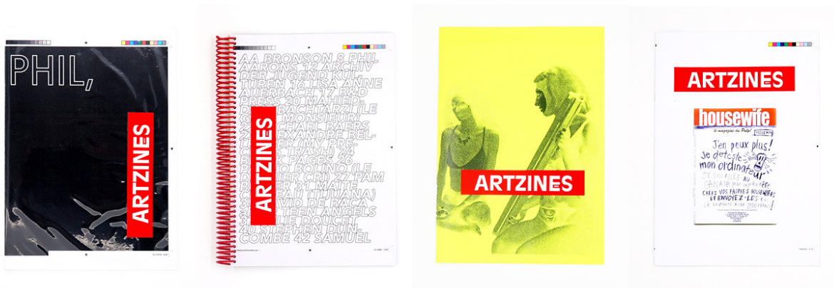
Figure 8. ARTZINES 12.5 à 16, 2018-2022

Puis j'ai rencontré les membres du collectif Objet papier , avec lesquels j'ai imaginé un format de narration et de création sur mesure dont le résultat sera une publication différente pour chaque lecteur-riche. Pour connaître la suite du projet ARTZINES, rendez-vous sur artzines.info .