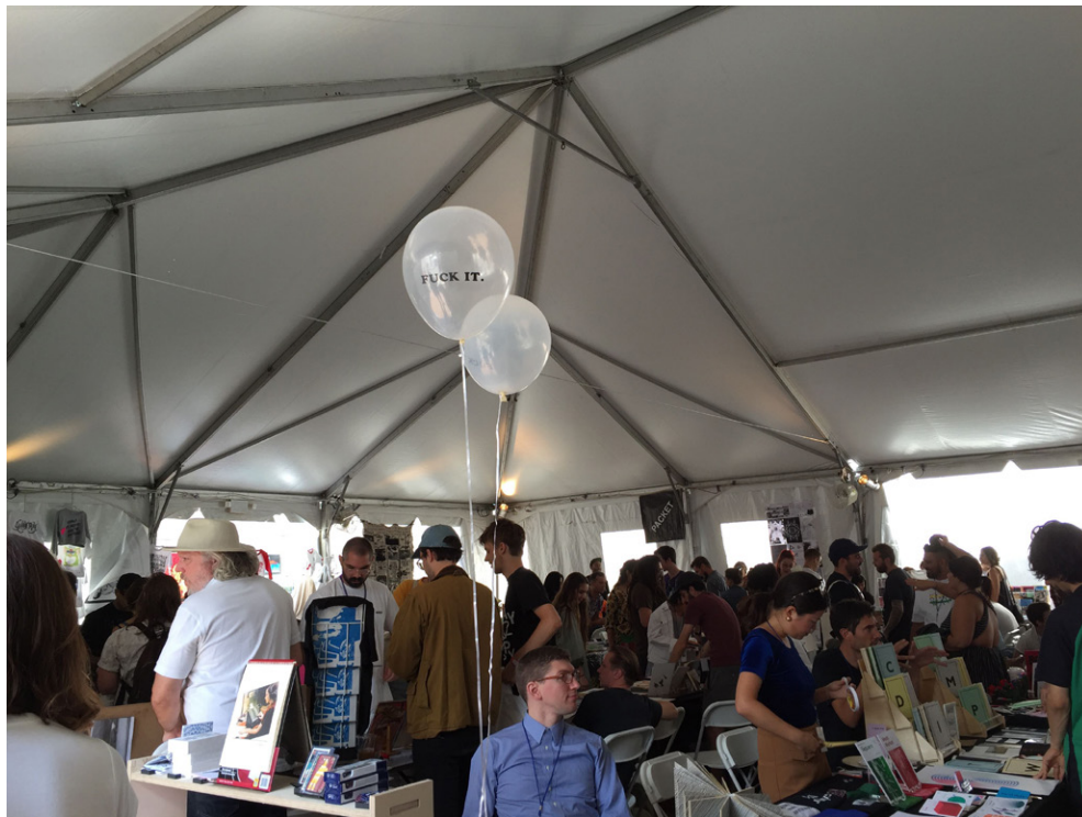
Figure 2. La tente des zines, New York Art Book Fair

Lorsque j'ai montré mon badge pour passer la file d'attente et entrer dans le musée, j'étais très fier que tous·tes ces gens se soient réveillés et habillés de façon si sophistiquée juste pour me voir! Bien que ma table dans la tente dédiée aux zines soit proche de l'entrée et que je sois peut-être la première personne à qui ils et elles allaient parler, ils et elles venaient probablement pour voir un éditeur plus établi. Mais je n'en avais rien à faire, car, en ce dimanche matin, je ne pensais qu'à cet homme rencontré le vendredi précédent pendant les horaires d'ouverture spéciaux, qui ne sont pas indiqués dans le programme et qui ne sont connus que des personnes importantes.