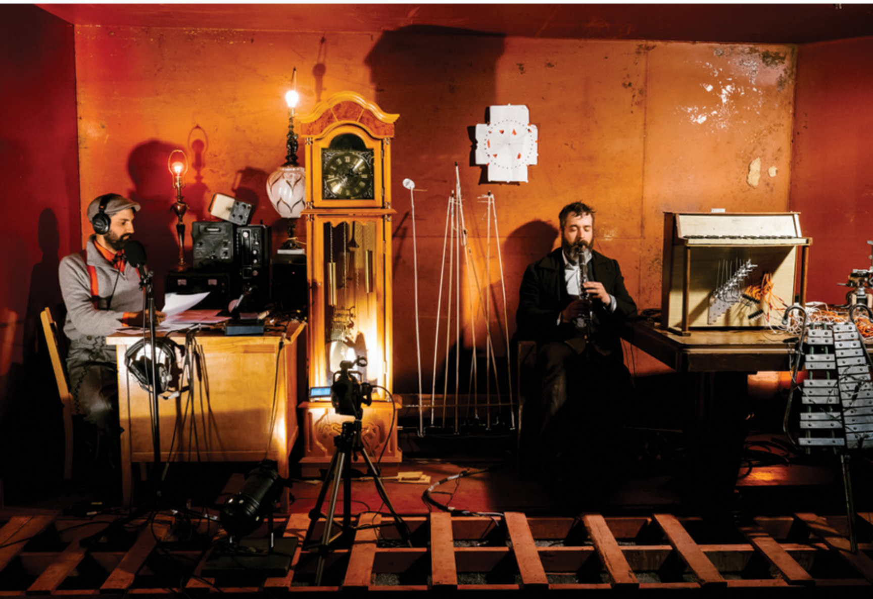
L'Orchestre d'hommes-orchestres et le Théâtre Rude Ingénierie Les Palais, 2015-2016 Carrefour international de théâtre de Québec

Page suivante : Tomates, 2018