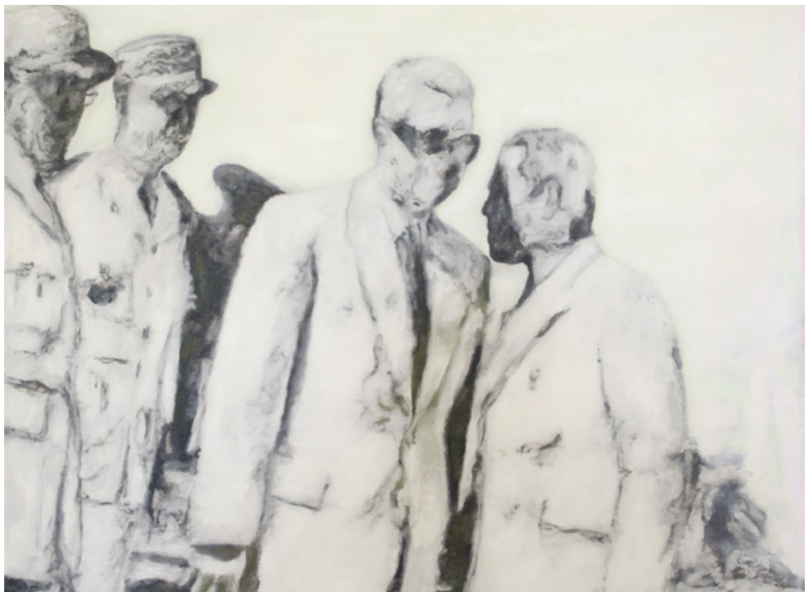
Phantom Shot , 2013 Huile sur lin, 60 x 81 cm

Page suivante : Totale paranoïa n° 2 , 2018 Collage et acrylique sur toile, 182,9 x 121,9 cm