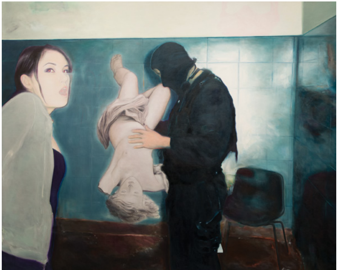
Ton rêve d'anarchie, 2011-2012 Huile sur lin, 207 x 257 cm