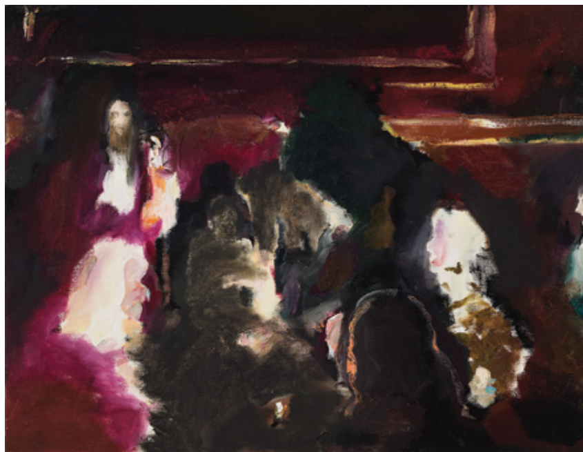
Hippie-psyop n° 10, 11, 13 , 2015 Huile sur lin, 44 x 57 cm