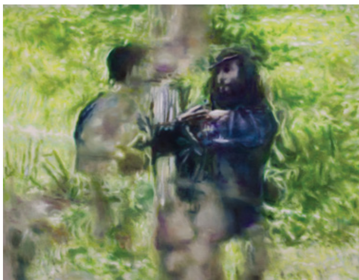
Capture 1, 2013 Huile sur lin, 125 x 162 cm