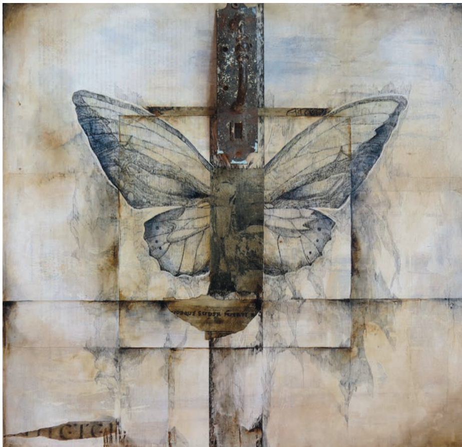
Brigitte Normandin, Papillon 6 , 2016, encre et objets trouvés sur papier, 51 x 51 cm

L'éducation des jeunes est primordiale pour l'avenir de la société, mais aussi parce qu'ils sont vulnérables à la violence. Au Canada, 46% des filles fréquentant une école secondaire affirment avoir été la cible de commentaires ou de gestes déplacés à caractère sexuel 1 . Au Québec, 43% des adolescentes qui vivent une relation amoureuse subissent de l'abus émotionnel, physique ou sexuel. Ces réalités sont encore plus alarmantes chez les jeunes filles vivant avec un handicap et elles témoignent en fait d'une socialisation problématique et de la reproduction de rôles de genre éculés, les garçons étant perçus, entre autres, comme ayant des «besoins» sexuels irrépessibles alors que les jeunes filles croient devoir préserver la relation à tout prix 2 . En ce sens, au-delà de la sexualité, un élément crucial du cursus scolaire devrait être l'éducation à l'égalité, une approche revendiquée par de nombreux groupes féministes.