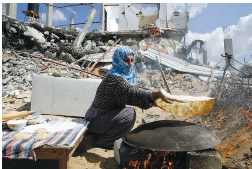
Palestinienne faisant son pain dans les ruines de sa maison à Khan Younés, 21 septembre 2014.