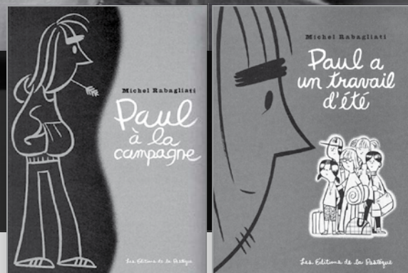
Illustration : courtoisie de Michel Rabagliati.

Depuis sa plus tendre enfance, Michel Rabagliati se passionne pour la bande dessinée. À onze ans, il souhaite même travailler pour Le Journal de Spirou , auquel il est abonné. Il dévore aussi Le Journal de Tintin et « copie » des auteurs qu'il admire : Goscinny et Uderzo, créateurs d'Astérix, Franquin, père de Gaston Lagaffe, ou encore Morris et Goscinny, inventeurs de Lucky Luke. À cette époque, les bandes dessinées française et belge bénéficient d'une distribution massive au Québec (avec les éditeurs Dupuis, Lombard, Glénat, etc.). Pour cet enfant plutôt solitaire, la BD représente à la fois une école de dessin et un passe-temps. À l'heure actuelle, avec le recul, l'auteur reconnaît que bien dessiner ne suffit pas et que la BD est un art d'écriture, un vrai travail d'écrivain.