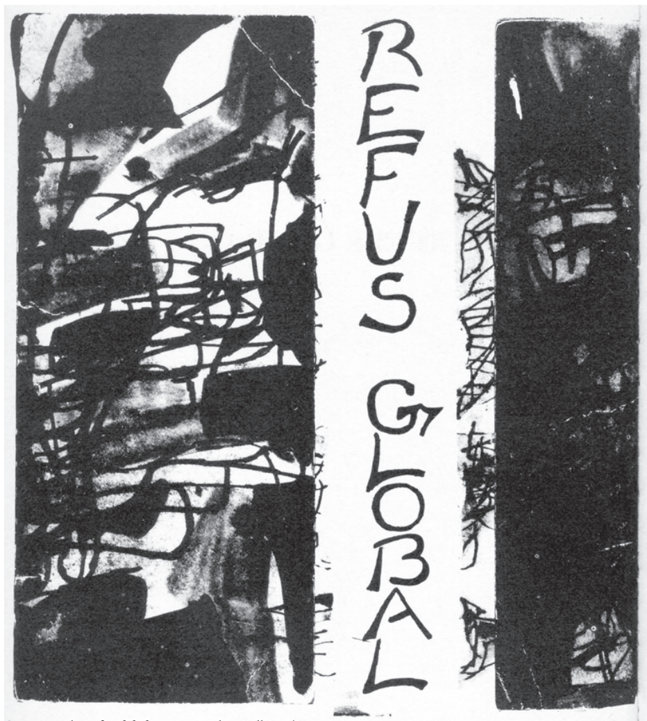
Couverture du Refus global par Jean-Paul Riopelle, 1948

Le Manifeste du surréalisme , le poème Karawane d'Hugo Ball, ceux de Claude Gauvreau, les œuvres dadaïstes et surréalistes, le cubisme, l'automatisme en écriture attestent de la réalité d'une génération d'artistes, toutes frontières confondues, déterminés à camper leurs démarches dans les marges. Ces groupes font partie d'un vaste mouvement d'avant-garde qui va se déployer sur les deux continents entre la fin de la Première Guerre et le début de la Seconde.