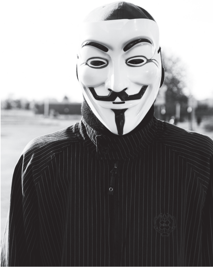
Masque des Anonymous inspiré du masque de Guy Fawkes

maintenant produit pour sa « valeur de perfectibilité ». Cette valeur apparaît lorsque l'art est produit mécaniquement, car elle écarte complètement la qualité unique de l'œuvre d'art en plus de faire disparaître ce qui est y est subjectivement intégré. L'œuvre d'art n'apparaît plus comme une œuvre en soi, mais comme une représentation du réel. Pour Benjamin, le film est le produit d'une fabrication mécanique en soi, il devient un miroir dans lequel le spectateur – et la spectatrice – se projette, puisqu'il n'y voit pas le travail mécanique qui a reconstitué le film. Le film devient, produit de cette manière-là, une marchandise.