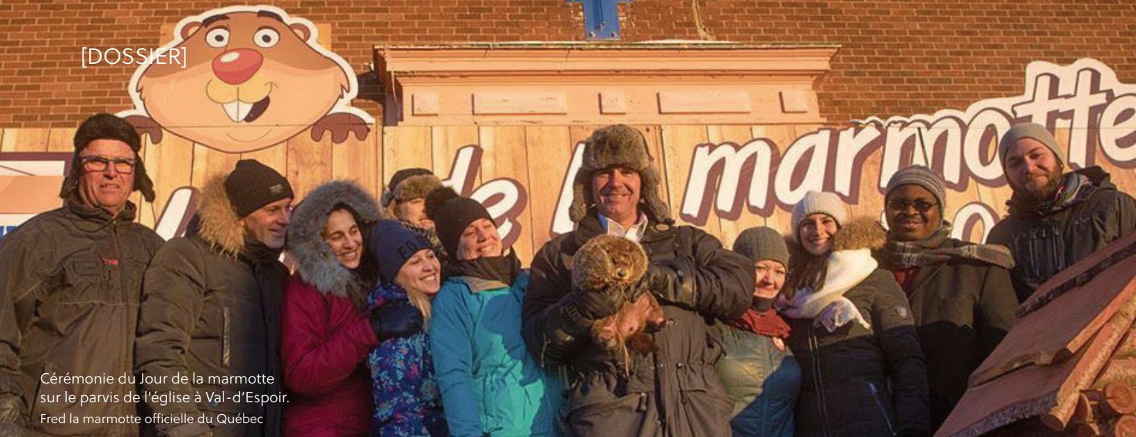
Cérémonie du Jour de la marmotte sur le parvis de l'église à Val-d'Espoir. Fred la marmotte officielle du Québec