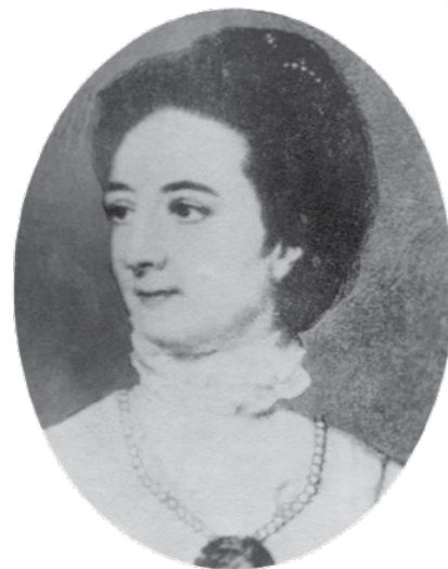
Lady Maria Carleton, née Howard, épouse de Guy Carleton.

Carleton est nommé en mars 1782 commandant en chef des forces britanniques en Amérique du Nord,