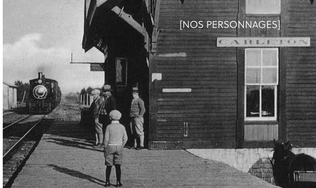
Gare de Carleton, vers 1930. Les noms des cantons de Carleton et Maria sont proclamés en 1842. Musée de la Gaspésie. Collection de cartes postales. P169

Dorchester contribue peu à l'élaboration par Londres d'une nouvelle constitution pour le Canada, soit l'Acte constitutionnel de 1791. Il