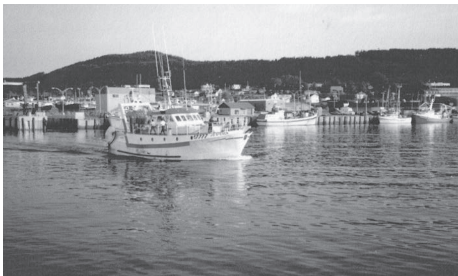
Le 3 e bateau de Melvin O'Connor.

est frappante, j'y trouve là ma plus grande satisfaction. Et j'aime améliorer mon travail. Aussi, à chaque fois que je fais une maquette, je découvre de nouvelles techniques et des sortes de bois qui se travaillent mieux. ♦