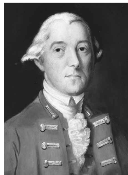
Sir Guy Carleton. Source : Musée de la Gaspésie. Fonds Musée de la Gaspésie. P1/16/1