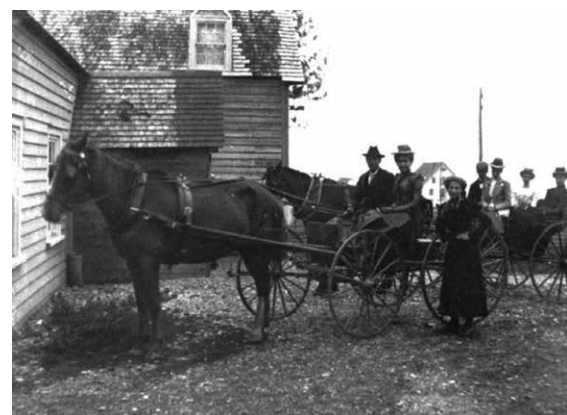
Sortie du dimanche à Pointe-Saint-Pierre.