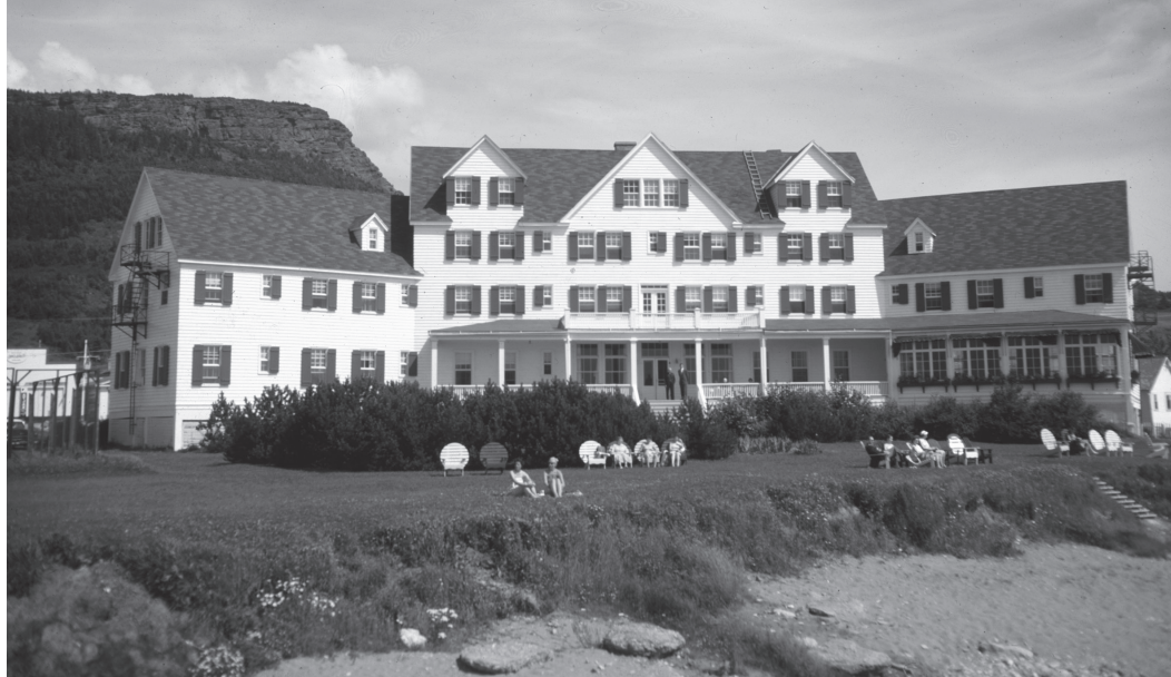
L'hôtel La Normandie de Percé, vers 1960.

P67/B/1b/2/36