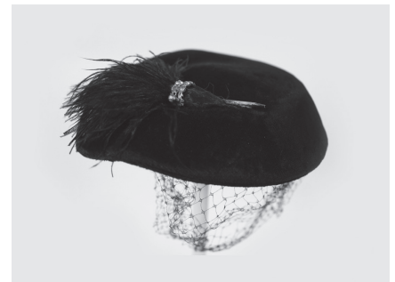
Chapeau donné par Diane Synnott et qui a appartenu à sa mère. Collection : Musée de la Gaspésie. 2010.3.3

Le style des chapeaux des années 30 et 40 est en total contraste avec la sobriété qu'imposent d'abord la Grande Dépression et ensuite la Deuxième Guerre mondiale. En effet, on retrouvait des chapeaux aux formes fantaisistes. Toutefois, la majorité des chapeaux féminins s'étaient masculinisés, mais présentaient une touche féminine. Ce feutre, ornementé d'une plume et d'une voilure, en est un bon exemple. ♦