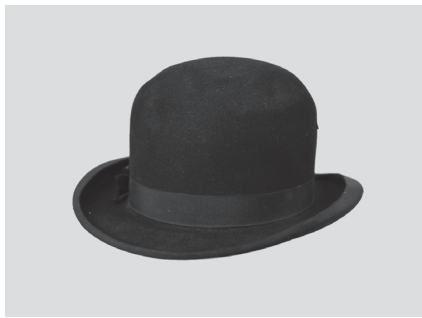
Chapeau provenant de la famille Lepage de Bougainville. Donné par Marian Kirkbride. Collection : Musée de la Gaspésie. 2014.6.1

Le port du chapeau et le style de celui-ci sont intimement liés à la mode du temps. À la fin du 19 e siècle et au début du 20 e siècle, le bonnet, qui avait longtemps été la coiffure extérieure par excellence des femmes, laisse place à une plus grande variété de chapeaux. On adopte volontiers les chapeaux aux rebords larges, comme celui du haut. Faite de paille aux mailles amples, cette coiffure est ornementée de fioriture de dentelle et d'une plume. Le modèle du dessous, plus simple dans sa confection, est tout de même représentatif de la mode en vigueur au début du 20 e siècle, alors qu'on privilégie les chapeaux que l'on perche sur le haut de la tête. En effet, la calotte de celui-ci, c'est-à-dire la partie qui s'emboîte sur la tête, est très peu profonde, ce qui oblige sa propriétaire à le fixer à sa chevelure.