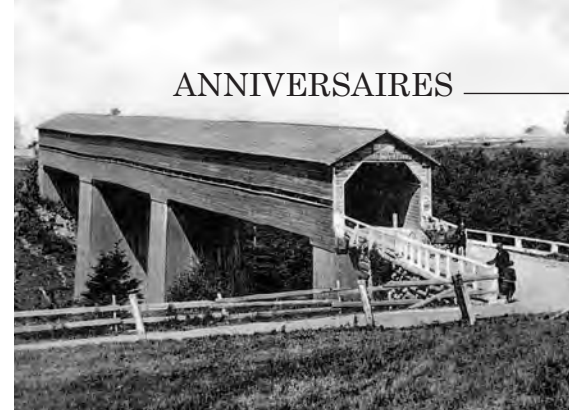
L'ancien pont Kelly à Saint-Siméon, vers 1930.