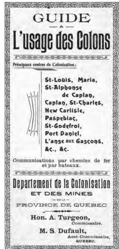
Brochure d'information aux gens désireux de venir s'installer en Gaspésie, notamment à Saint-Louis.

P162/5/50.