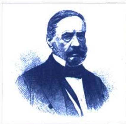
PHILIPPE AUBERT DE GASPÉ