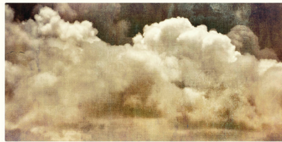
Emiliano Monge Les terres dévastées

Ils n'arrêtaient pas... ils m'ont vu et même là ils n'ont pas cessé , dit Marcos en enlaçant sa femme qui, d'une voix basse,