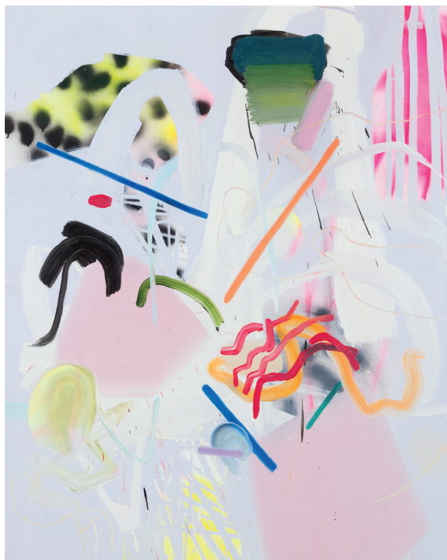
Yielding a Little (to Yellow and Black) , 2016. Huile et aérosol sur toile. 60 x 48.