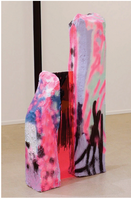
Everything Collides (in the Future) , 2015. Huile et aérosol sur toile. 60 x 48. Huile et aérosol sur mousse polyuréthane.