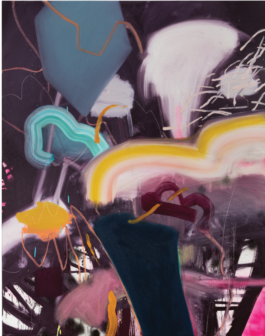
Begin and End (Together, in Purple) , 2016. Huile et aérosol. 60 x 48 pouces.

nées d'activité dans des centres d'artistes influencent probablement ce désir. J'éprouve le besoin d'encourager ces liens qui nourrissent la communauté artistique. Puisqu'on m'a généreusement offert cette possibilité, j'ai naturellement envie de redonner aussi. » Lefort a travaillé pendant cinq ans, en tant qu'artiste et commissaire, au centre Axénéo7. Les meilleurs artistes au pays ont presque tous fréquenté ce genre de centres, m'explique-t-elle, car ceux-ci permettent à chacun de mieux définir son propos et de se mettre à risque en explorant de nouvelles avenues.