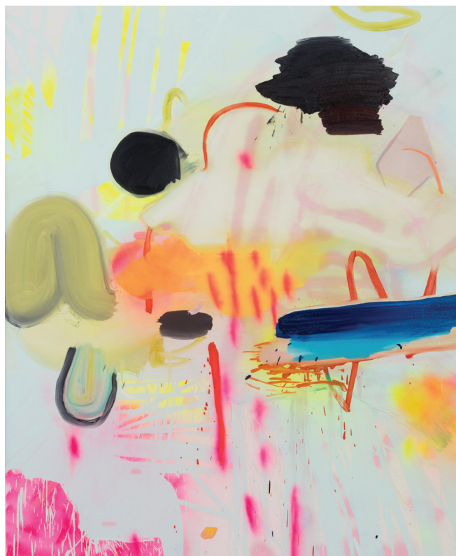
Uninterrupted Conversation , 2016. Huile et aérosol sur toile. 60 x 48.

La galerie Patrick Mikhail présentera ses tableaux récents à Montréal du 24 septembre au 6 novembre 2016.