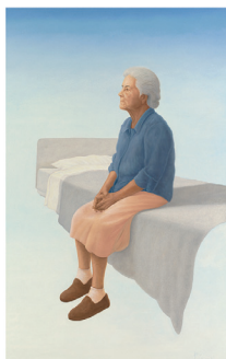
Pendant ce temps au CHSLD