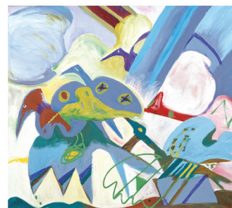
Pandémie Premiers enseignements