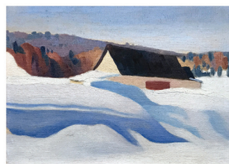
Le français, langue infantile McGill manque d'ambition