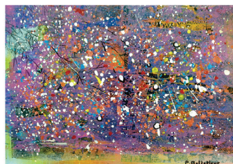
Défaire ce qui défait