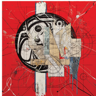
Les privilèges de l'anglosphère