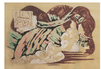
Le statut du français Entre possible et résignation