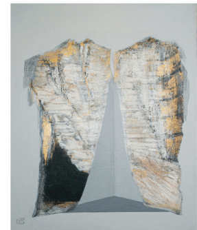
La cour des autres