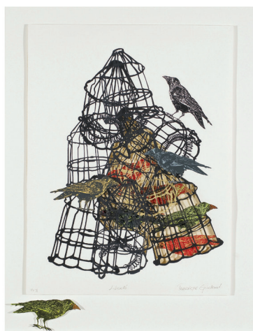
De Gaulle 1967 Vive le Québec libre!

Juin-Septembre 2017 vol. XVII, n° 6-7 L'Action NATIONALE 1917-2017