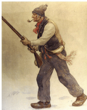
L'Acte d'Union La deuxième conquête