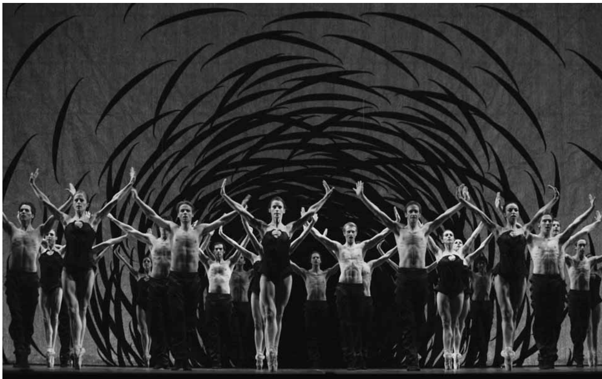
Emergence de Crystal Pite (Ballet National du Canada), présenté par Danse Danse en octobre 2010.

Au sein de la programmation de Danse Danse, le Ballet National du Canada présentait à la Place des Arts 24 Preludes by Chopin de Marie Chouinard et Emergence de Crystal Pite. Réunissant 38 interprètes de haut vol, cette dernière pièce s'est avérée des plus saisissantes. Une migration aux teintes plus sombres, mais foudroyante de rythmes puissants. En fond de scène apparaît une sorte de nid immense ou un cyclone au cœur duquel se trouve un centre noir, un trou sans fond. Les danseurs disparaissent dans ce tunnel puis en ressortent comme des insectes ou des chauves-souris agitées, rapides et gracieuses. Les hommes, au ras du sol et masque noir sur la tête, bougent telle une horde. Ce mouvement de foule aux rythmes et aux bruits saccadés évoque une meute, un déploiement militaire. Les femmes, sur pointes, se déplacent de leurs petits pas ailés avec une synchronisation parfaite. Elles forment une longue ligne, ne laissant voir que leur profil. Un effet de multiplication surgit. Elles avancent tel un mur, repoussant ainsi les danseurs présents sur scène. C'est engloutissant, médusant. La musique laisse entendre la respiration profonde d'un prédateur. Le groupe se mobilise. Les portés sont ingénieux, accentuant le côté volatil de la pièce. Les mouvements opposés dans un même corps, mais aussi au sein de ce grand groupe, créent pourtant une unité. La question du