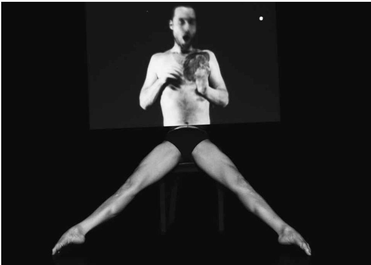
Cloak de George Stamos, présenté à l'Agora de la danse en octobre 2010.

De petites montagnes sur scène sont entourées de lignes et de dessins topographiques au sol ; des courbes qui accueilleront diverses explorations sur la maniabilité et la transformation du corps. L'interprète entre en scène avec un grand bâton grâce auquel il trace au sol – plongeant la longue branche dans l'encre – une sorte de labyrinthe déterminé par les quatre points cardinaux reliés entre eux. Le bâton devient une direction, une ligne du temps qui oscille entre les mains de ce danseur ayant plus d'un tour dans ses poches. Il en sort d'ailleurs de grosses noix qu'il met dans sa bouche et qui cognent sur les dents, créant le bruit d'un roulement. Une nouvelle forme de percussion à l'intérieur du corps. Puis, il joue avec des élastiques, les étire juste avant qu'ils ne cèdent, s'y entortille et s'en dégage. Ce jeu formel évoque la souplesse, l'élasticité du corps, du temps et de l'espace, qui trouvent nœuds et dénouements. Ces quelques explorations, sondant à la fois le physique et la physique, sont entrecoupées de moments parodiques où Bélanger emprunte une voix presque cosmique qui surprend, fait peut-être sourire, crée une rupture dans la dynamique conceptuelle du propos, mais qui aurait pu être mieux exploitée,