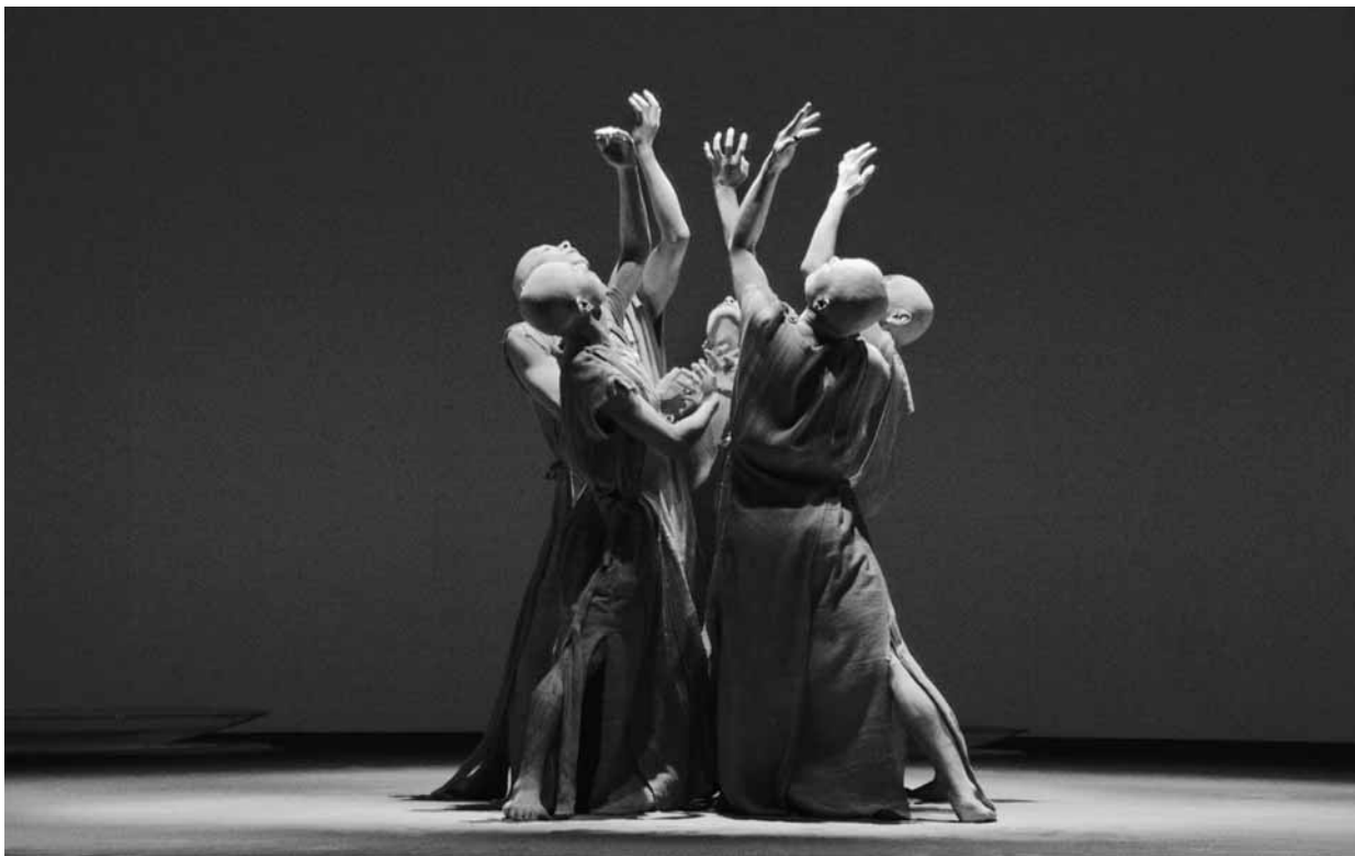
Hibiki de Sankai Juku, présenté par Danse Danse à l'automne 2010.

l'âme dans un fin rituel de rigueur et de concentration, dont les effets visuels sont bouleversants. De grandes soucoupes au sol accueillent le bruit de gouttes d'eau qui tombent d'une sorte de sablier aqueux suspendu au plafond. La scénographie est déjà hypnotisante. Le moindre geste, la moindre goutte, sont à la fois sublimes et violents. Torse nu et crâne rasé, le corps blanchi de poudre de riz, les interprètes déploient des nuages dans l'espace. Au sol, ils s'élèvent puis se recroquevillent : la gravité semble toute légère et l'envol grave. Avec leur jupe faite de tissus plissés, ces êtres spectraux bougent doigts, poignets, mains et bras de manière souple, vaguée, puis pointent l'horizon. Ils traversent la scène, comme on traverse l'histoire, dans un mouvement de balancement. Dans la répétition des gestes – méditatifs et ancrés –, un écho se développe entre les danseurs. L'infime déploie l'infini. La musique fait appel à différents registres : des percussions graves font place à des bruits aigus, grinçants, puis à un grondement dramatique, un sifflement. Les différents tableaux sont séparés par l'obscurité, une pause dans le noir, face au rien, face à l'inattendu. Puis, cette évolution mène à une scène aux teintes sanguinolentes. Les robes à lacets rouges, les grosses boucles d'oreilles, le liquide couleur sang au fond des soucoupes dans lesquelles les danseurs font mine de plonger pieds et mains, évoquent une