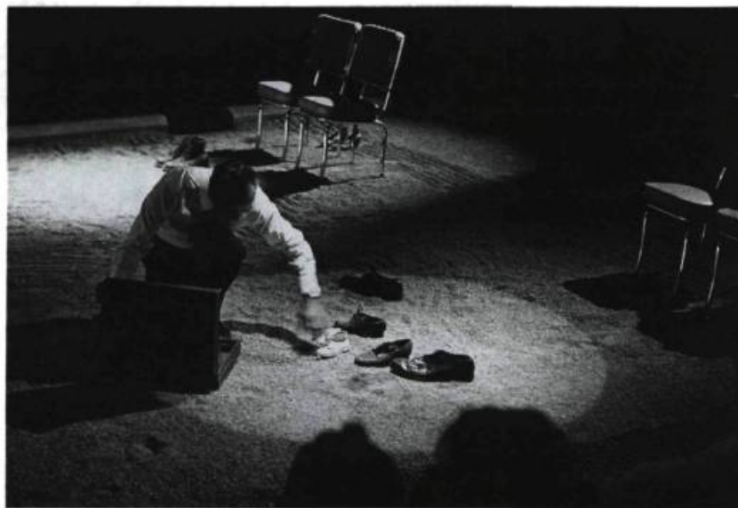
La Trilogie des dragons (Théâtre Repère, 1987).

sont rares. Mais même quand des actes de violence physique sont représentés , ils doivent l'être dans le contexte d'une mise en scène qui leur donne un sens et une cohérence par rapport à la pièce, qui nous amène à en ré-prover l'usage, mais surtout à rejoindre en nous-mêmes le lieu où nous pourrions nous aussi les perpétrer ; autrement, nous nous sentons nous-mêmes violents.