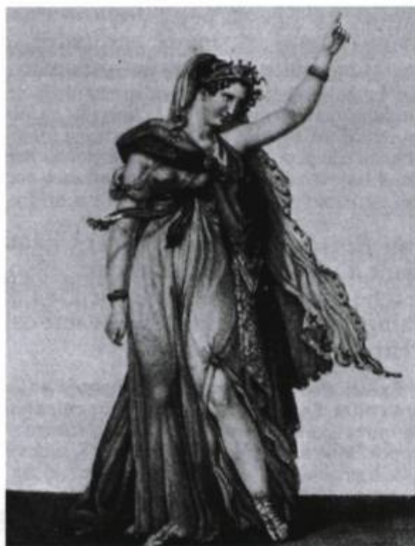
La Champmeslé (1642-1698) dans le rôle de Phèdre, qu'elle a créé. Œuvre de Prud'hon (fin XVIII e siècle).