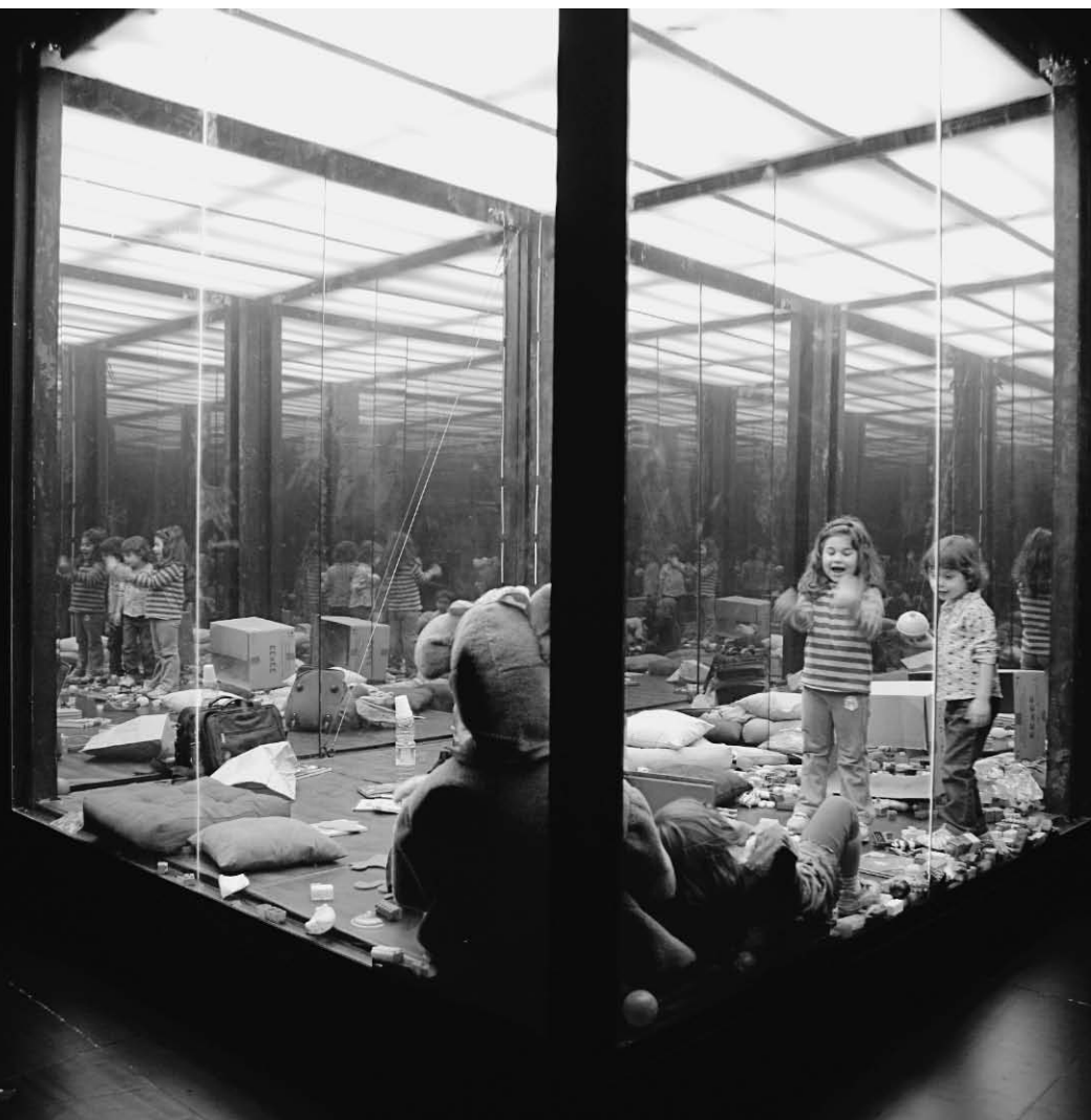
Inferno de Romeo Castellucci (Societas Raffaello Sanzio).

procédaient à une traversée de la scène manifestement chorégraphiée, donc préméditée, l'arrivée des enfants en très bas âge nous incitait à croire que ce à quoi nous assistions se dessinait spontanément. Dans une œuvre comme celle-là, il est vrai qu'à un moment donné notre position critique vis-à-vis de l'œuvre en cours laisse place à un étonnement. Que vont-ils faire ? Sont-ils conscients du jeu auquel ils prennent part ? Ou bêtement : est-ce que l'un d'eux va se mettre à pleurer ? C'est aussi le rapport au temps qui se trouve affecté. On se trouve moins dans le temps de l'œuvre, moins dans le temps vécu à travers les choix du metteur en scène, que dans le temps de l'enfant. On a soudain moins tendance à mettre en lien les actions les unes avec les autres pour se créer une cohérence ; on est plutôt absorbé dans le présent. On sait qu'à ce moment du spectacle, personne ne sait ce qui va se produire. On observe, amusé, comment une petite fille va réagir alors que son comparse vient d'envoyer au sol les craquelins qu'elle était en train de manger.