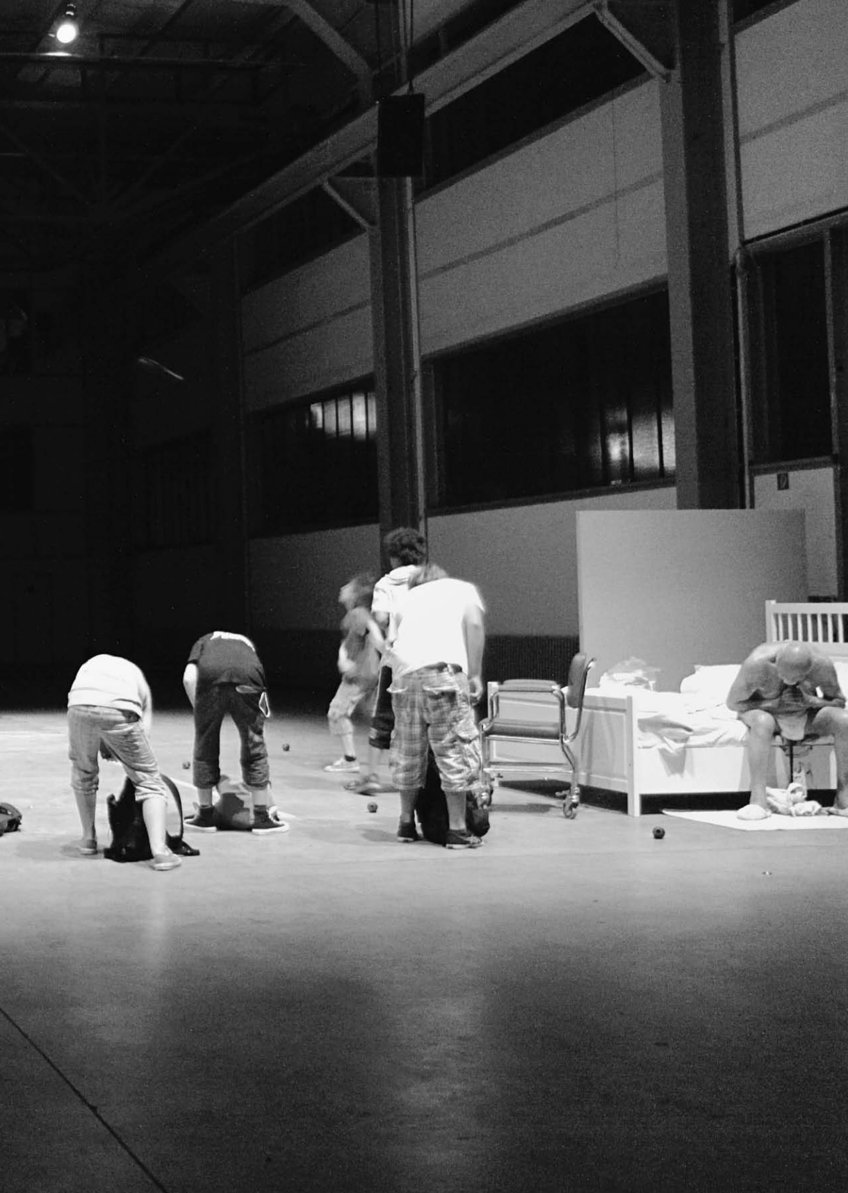
Sul concetto di volto nel figlio di Dio de Romeo Castellucci (Societas Raffaello Sanzio).