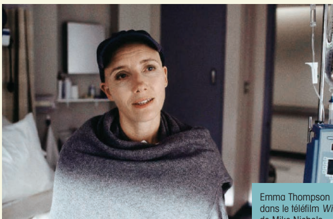
Emma Thompson dans le téléfilm Wit de Mike Nichols (2001), adaptation de la pièce de Margaret Edson.