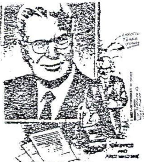
Chester Carlson Inventor of Xerography