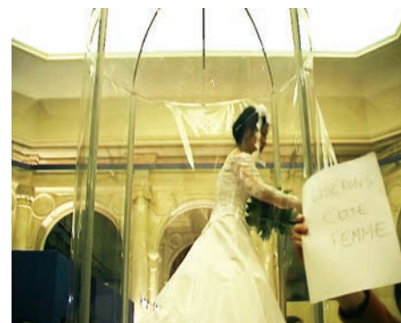
> Tsuneko Taniuchi, Micro-événement n° 21 / Candidature en vue du mariage , exposition Intimités , Hôtel de Ville, Paris, 2003.

Le 8 mars 2003, lors de l'exposition Intimités à l'hôtel de ville de Paris, « Micro-événement n° 21 / Candidature en vue de mariage » souligne l'ampleur prise par la performance qui touche désormais un public plus large et utilise le lieu exact de la signature des registres, le jour de la Journée internationale des femmes. L'artiste étant d'origine étrangère, naturalisée française, c'est aussi à la situation des femmes étrangères se mariant pour acquérir la nationalité française qu'elle fait écho. Au centre de la salle des mariages, Tsuneko Taniuchi est juchée sur une estrade rose, dans une bulle qui tourne lentement, telles les poupées des vitrines de Noël, et chante When I Fall in Love dont les paroles comprennent un passage ironique : « In a restless world like this is, love is ended before it's begun, and too many moonlight kisses seem to cool in the warmth of the sun. » La parodie amoureuse tourne alors à plein régime. D'ailleurs, une femme, vraisemblablement féministe, fabrique spontanément une pancarte où elle inscrit :