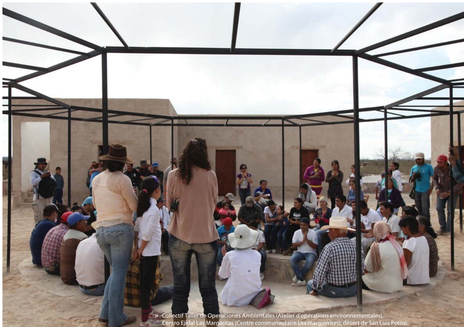
> Collectif Taller de Operaciones Ambientales (Atelier d'opérations environnementales), Centro Ejidal Las Margaritas (Centre communautaire Les marguerites), désert de San Luis Potosí.

Dans notre monde globalisé, les liens entre l'homme et l'environnement sont, depuis quelque temps, en crise constante. Les avancées technologiques ainsi que la prééminence du développement économique produisent une perte fréquente d'attachement au terroir, doublée d'un déséquilibre écologique. Les villes se voient donc affectées. L'architecture, l'écologie et l'économie sont souvent entendues séparément, sans qu'on puisse prêter attention au besoin de les aborder conjointement et consciemment sous une approche durable. Dans ce contexte, il devient important de redéfinir le territoire et sa mise en valeur, ainsi que de repenser les stratégies d'occupation et de modélisation des espaces.