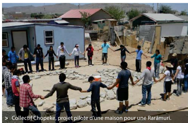
> Collectif Chopeke, projet pilote d'une maison pour une Rarámuri.

Pour le premier travail qu'ils ont réalisé en 2014, ils ont construit un prototype de logement aux murs de paille et de terre cuite, thermiques, durables, résistants et économiques. Ils ont mis en