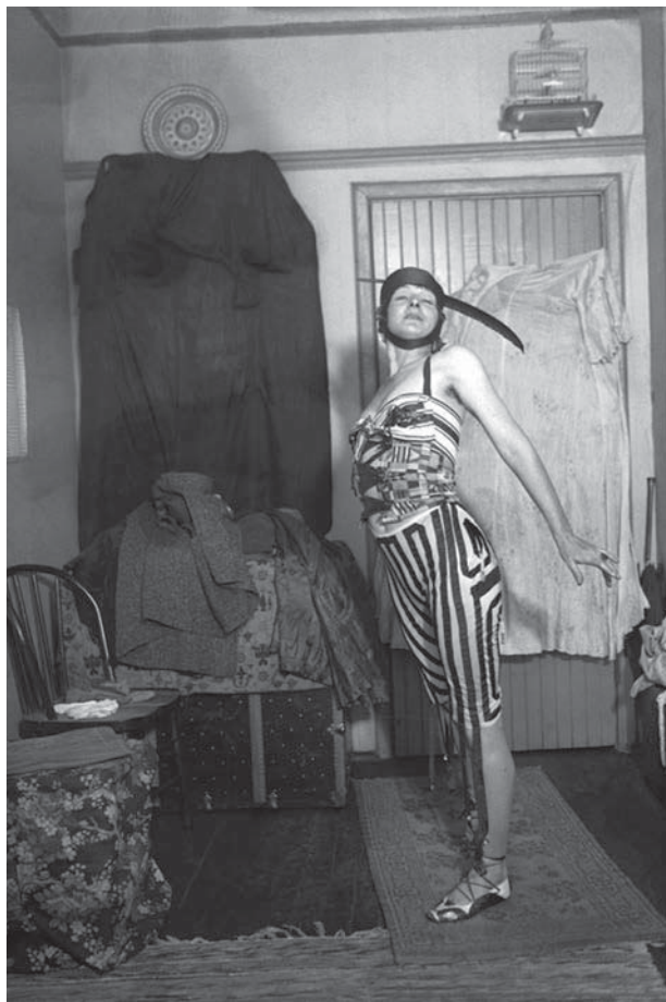
Elsa von Freytag-Loringhoven.