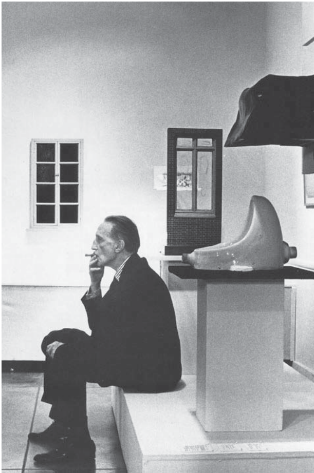
Marcel Duchamp, Pasadena Art Museum, Los Angeles, 1963.