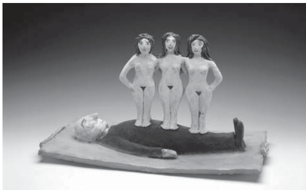
Beatrice Wood, Career Women , 1990.

5 mai 1917 – Le milieu artistique et littéraire new-yorkais est imprégné de références aux arts asiatiques, très en vogue à cette époque. C'est pourquoi l'article de Louise Norton « "Buddha of the Bathroom" » ( The Blind Man , n° 2) dévoile l'intention derrière la mise en scène de l'urinoir dans la photographie de Stieglitz, comme si Norton en avait assumé la direction photo.