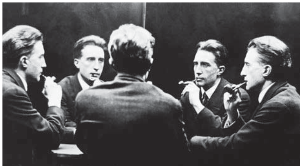
Marcel Duchamp, Autoportrait multiple , 1917.

Les premiers jours d'avril sont consacrés aux préparatifs du Salon. Duchamp, George Bellows et Rockwell Kent sont responsables de l'accrochage. Katherine Dreier est responsable de la réception. Si Demuth, Norton, Schamberg et bien sûr Duchamp lui-même s'étaient présentés en personne pour déposer l'œuvre, elle les aurait reconnus.