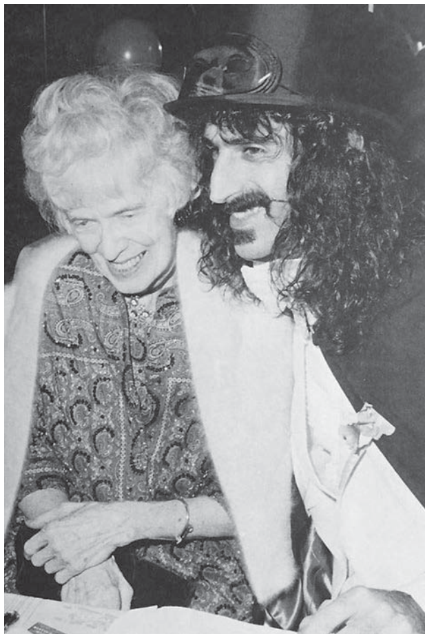
Louise Norton (Varèse) et Frank Zappa, 1974.