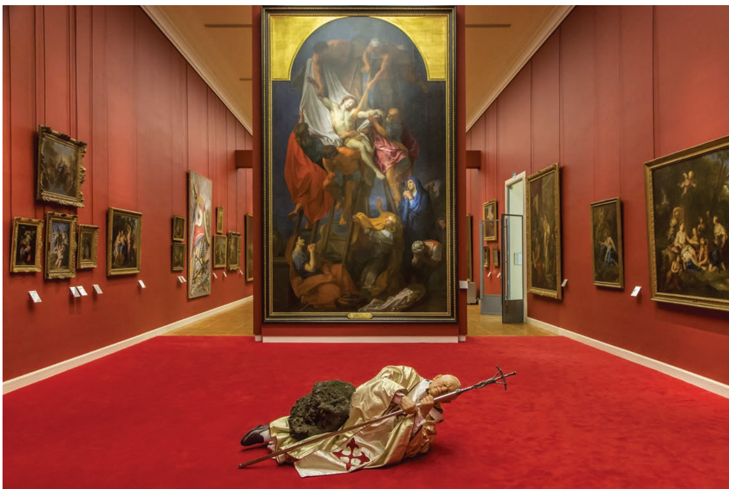
> Maurizio Cattelan, La Nona Ora, 1999. Vue de l'exposition au Musée des beaux-arts de Rennes, France, 2014.

Pologne, à la galerie d'art nationale Zachęta à Varsovie. Comment a-t-il osé faire une telle plaisanterie en cette patrie de gros bonnets ? Même si le pape Jean Paul II est mort depuis plusieurs années, de grandes affiches de son image sont toujours accrochées sur presque chaque portail d'église polonaise, témoignant du respect et de l'admiration des concitoyens. C'est dans ce contexte que Cattelan a exposé son travail. Pour ridiculiser l'idole religieuse de la Pologne, il a mis en scène un météore ayant fracassé la vitre d'une église pour s'écraser sur le chef de l'Église catholique. Sur un tapis rouge vif près des éclats de verre scintillants, une sculpture du pape Jean Paul II le montre comme s'il venait de tomber maladroitement, provoquant le malaise.