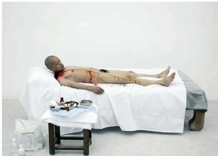
> He Yunchang, One-Meter Democracy , 2010.

Il est vrai que certains artistes utilisent spécialement le risque comme moyen d'expression. Maurizio Cattelan, un artiste contemporain italien reconnu en tant que « bouffon » de l'art, sait profiter pleinement du risque pour mettre en scène des œuvres explosives, attendues de tous. Il a présenté La Nona Ora , une satire du pape Jean Paul II, né en