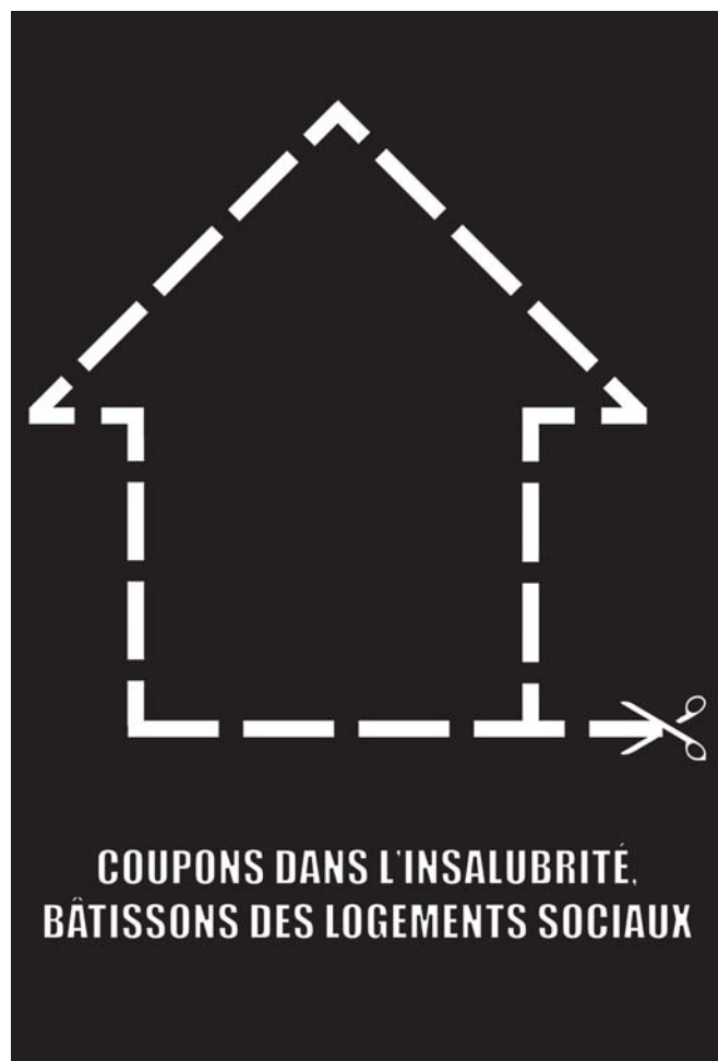
> Affiche : Émilie Lafontaine.

Les lieux de perdution sont multiples dans nos centres-villes comme nos banlieues. L'intervention de la rue Morin incarne les potentiels de l'action citoyenne et créative qui, en investissant des lieux stratégiques de l'espace public, à partir de matériaux de base, permet d'instaurer un nouveau dialogue démocratique susceptible de mettre en relation des acteurs provenant de divers horizons afin de pallier un manque. ◀