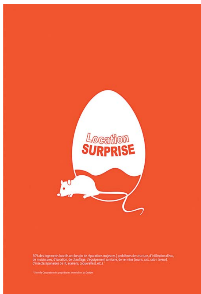
> Affiche : Valery Lemay.

Par une matinée à -25 degrés Celsius, c'est une trentaine d'affiches, chacune unique par le choix des images et des mots, que les étudiants ont agrafées à même le revêtement extérieur de la maison. Tel un ricochet, cette opération a provoqué une série d'ondes qui se sont répercutées à divers niveaux : de l'Université aux citoyens en général, en passant par les organismes communautaires, les habitants du quartier, le service de l'urbanisme, la mairie, la Ville et les médias. En s'appropriant le lieu et le moyen d'expression, les étudiants se sont aussi approprié une cause, ils en sont devenus les ambassadeurs. Au-delà de la présentation de son