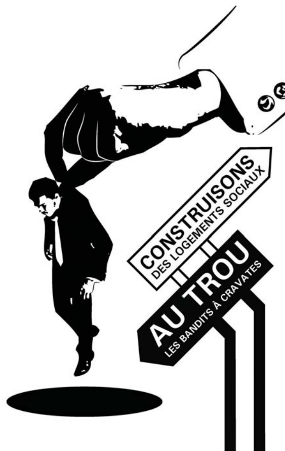
> Affiche : Elodie Nonnon.