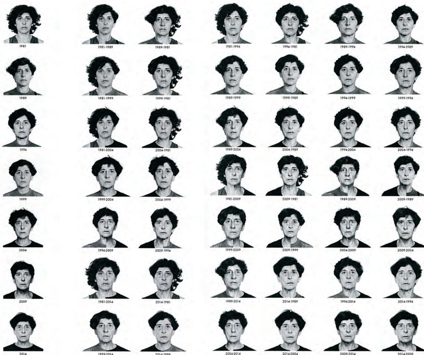
> Autoportrait dans le temps , 49 photos noir et blanc sur aluminium, 40 x 50 cm chaque, 1981-2014.