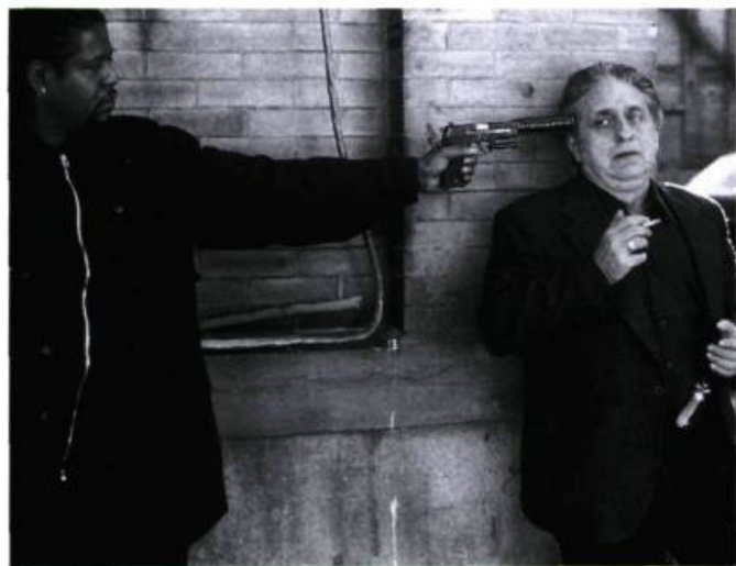
Ghost Dog (Forest Whitaker) et Louie (John Tormey).

Le scénario basique (il s'agira, comme dans tout film de gangsters, de savoir qui le premier éliminera l'autre, qui, entre un mafieux et Ghost Dog, sera abattu) emprunte une logique des sensations dans laquelle la substance du récit et sa forme ne font qu'un, appartiennent à un même mouvement qui fait décoller littéralement le film. (La musique du groupe RZA, faite de répétitions à l'infini et qui se boucle comme une bande de Moebius, n'est pas pour rien dans l'aspect rêveur, à la limite de l'hallucination, que dégage l'œuvre.) Une logique qui pose l'image comme une chose insaisissable, volatile (la présence des oiseaux est métonymique), un peu comme Ghost Dog lui-même, un être qui n'est jamais là où on l'attend, disparaissant et réapparaissant, déterritorialisant tout espace. Ghost Dog est un film des fluides, où tout glisse, coule, se délie et se dilue; un film de l'apesanteur, fidèle en cela à ses références nippones et aux préceptes bouddhistes selon lesquels «la forme est le vide et le vide est la forme» et les contraires doivent s'abolir. Il n'existe pas de barrières entre les personnages (dénudés, d'ailleurs, de toute psychologie explicative): ainsi Ghost Dog et Raymond (Isaach de