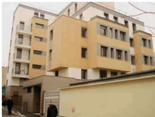
MAISON DES BABAGAYAS

l'ésotérisme, dans le chamanisme, mais là, je suis dubitative. Il y a par ailleurs un métissage de la société vécu dans les couples. Les mariages mixtes ne sont pas toujours bien acceptés par les deux parties et le jeune couple vit souvent à l'écart, en se protégeant le plus possible. Mais ce qui est intéressant, c'est la cuisine... on mange plein de bouffes différentes et comme les femmes sont toujours joyeuses par le ventre, c'est bien. Puis elles commencent à parler de leur mariage forcé, de la polygamie, de l'excision, de l'infibulation, etc.