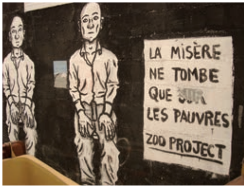
RUE DE MONTREUIL, PRÈS DE LA MAISON DES FEMMES