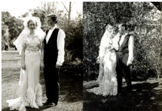
COLLECTION SÉBASTIEN LIFSHITZ

Vous avez été de toutes les luttes, incluant les luttes anticolonialistes. Oui, c'était aussi lié à l'Église. On retrouvait les curés dans des mouvements sociaux tels que le Mouvement de la paix, qui était crypto-communiste. La paix est bien entendu un thème évangélique. C'est là qu'on voit que militer, c'est trouver de l'intelligence, c'est trouver des gens qui ont lu et vous initient, c'est trouver des amis, des vrais copains, une atmosphère, des repas, des fêtes... C'est un moment de la vie et c'est en même temps changer le monde tout le temps, car le monde est constamment en marche. J'ai cheminé comme ça de 1948 à 1968. J'avais été pendant 20 ans cette femme qui faisait la cuisine, tenait bien sa maison et s'occupait des enfants. Pas de vie professionnelle, bien sûr. Je n'ai eu un chéquier à moi qu'en 1965. Il y a des choses dont il faut se rappeler. Je faisais du mieux que je pouvais, mais avec un profond sentiment d'enfermement, sauf avec les enfants. J'ai donc eu une vie de jeune femme plutôt