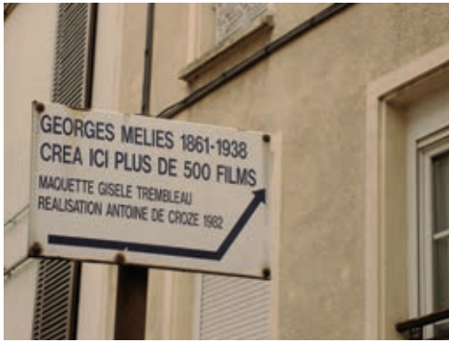
LIEU DES STUDIOS MÉLIÈS