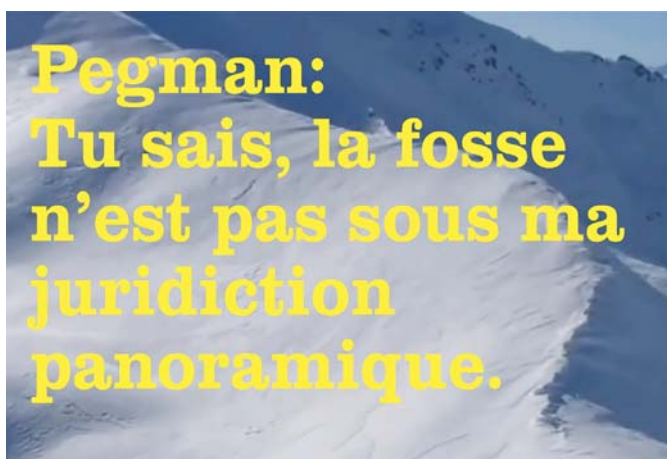
Fleur du pays, Pegman oder der zeitgenössische Cowboy (2015)

pointe est une préoccupation sociale réactivée après une longue période où prévalut le mythe du progrès. Quelle ne fut pas ma surprise en lisant récemment « Le gang de la clef à molette » d'Edward Abbey (un petit groupe judicieux va s'attaquer, tel Goliath contre David, aux immenses infrastructures pétrolières ou minières qui détruisent les plus merveilleuses contrées américaines sans souci des habitants qui y vivent), de découvrir la dédicace: « In Memoriam: Ned Ludd (...) un fou qui, dans un accès de rage, vers 1799, démolit de ses mains deux métiers à tisser appartenant à un manufacturier du Leicestershire. » Un personnage « oublié » par l'histoire sociale (même et surtout par la gauche progressiste) qui a pourtant (sans le savoir) donné naissance à un mouvement révolutionnaire né en Angleterre, puis européen, nommé le Luddisme . Des ouvriers ou paysans clairvoyants, au moment de la révolution industrielle, ont aussitôt compris que les machines, si elles n'étaient pas entre les mains du peuple, allaient provoquer chômage, déqualification des travailleurs, déshumanisation de la société. Disons comme Byron: « A bas tous les rois, excepté le roi Ludd! »