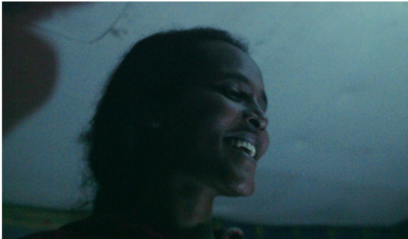
L'Héroïque Lande, la frontière brûle (2017)

de La Blessure succèdent ici les sans droits d'une nouvelle matrice opaque, celle des camps qui tendent à se substituer aujourd'hui à la cité . De films en installations, le travail de Nicolas Klotz et Élisabeth Perceval s'avère une fois de plus d'une cohérence exemplaire, s'efforçant de ramener sur les rivages de la vie et dans le mouvement de l'Histoire tous « les hors du monde » de la modernité. Dans L'Héroïque Lande, la frontière brûle , les cinéastes répondent à un appel lancé par notre époque - où les discours anti-immigration trouvent de plus en plus d'échos - pour produire des images non récupérables par l'ordre social avec une foi inébranlable dans ce présent aux riches potentialités qu'Agamben associe à « ce qui reste non vécu. »