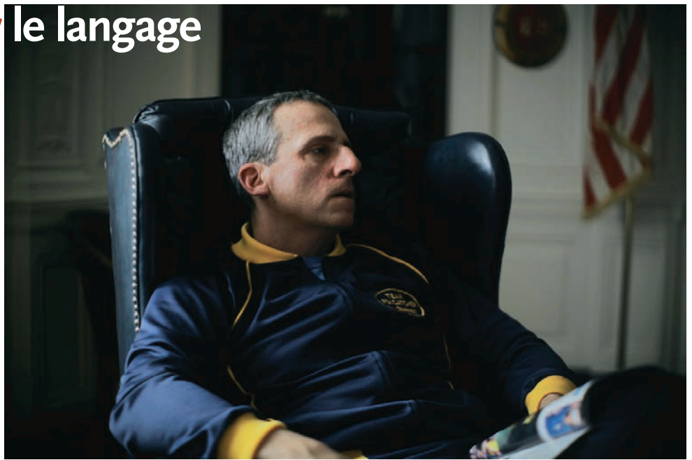
FOXCATCHER de Bennett Miller

LE DERNIER FESTIVAL DE CANNES A MIS EN LUMIÈRE L'INTERROGATION DES CINÉASTES DANS LEUR RAPPORT au langage comme système de signes, jusque dans la définition d'un style. Or, la langue s'est elle aussi invitée dans ce questionnement d'une façon paradoxale, au point de devenir un élément de la mise en scène pour certains films. Le hasard fait bien les choses, puisque quatre films primés (est-ce vraiment le fruit du hasard ?) illustrent ce point de vue d'un cinéma tiraillé entre la valeur du silence et le poids des mots. Ce coup d'œil sur ces titres, départagés en deux blocs distincts, illustre la thèse et l'antithèse de ce questionnement sur la langue, ou à tout le moins sur l'importance relative des dialogues au cinéma. Du coup, il permet d'attirer l'attention sur des films dont la sortie est prévue à l'automne et qui trouveront à s'inscrire à leur façon dans l'histoire du cinéma.