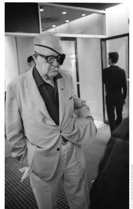
Fritz Lang à Montréal en 1967.