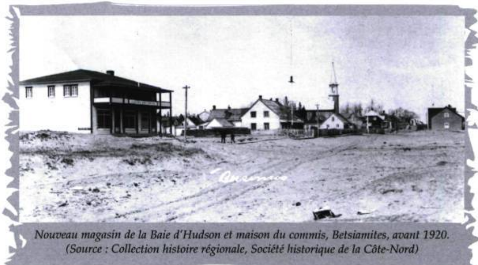
Nouveau magasin de la Baie d'Hudson et maison du commis, Betsiamites, avant 1920.

Au XIX e siècle, la Réserve de Betsiamites marque la grande frontière du Labrador, car c'est là que s'arrêtent alors les peuplements originaires de Charlevoix et de la vallée du Saint-Laurent, là que se concentre, l'été, le monde autochtone traditionnel dont les mouvances s'étendent sur toute la grande péninsule du Québec-Labrador, et là que s'installent les multiples