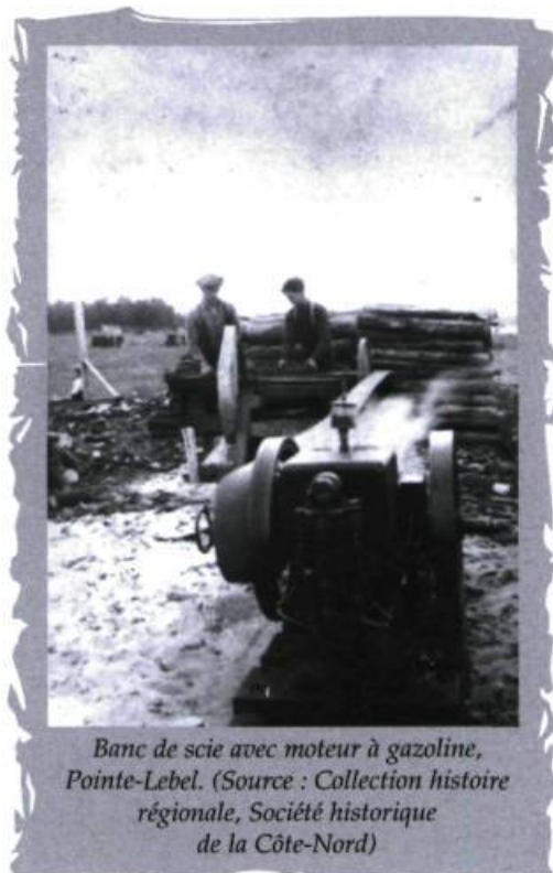
Banc de scie avec moteur à gazoline, Pointe-Lebel.

Cette invasion massive de leurs territoires ancestraux perturbe profondément les Innus qui multiplient les protestations et les pétitions auprès du gouvernement du Canada-Uni. La situation est d'autant plus inquiétante pour eux que les autorités gouvernementales commencent à vendre, à bon prix, les droits de pêche au saumon dans les meilleures rivières à certains sportsmen privilégiés, entre autres à des banquiers, des officiers de l'armée impériale, des juges... Pour faire taire les critiques, en particulier celles des missionnaires révoltés par ces injustices flagrantes pratiquées au nom du progrès et de la civilisation, le gouvernement crée la Réserve Manicouagan en 1951, vite démenagée à Betsiamites dix ans plus tard. Il s'agit d'un petit territoire littoral qui veut, initialement, regrouper toutes les familles innues de la région pendant leur séjour estival près du fleuve. Il faut d'ailleurs rappeler que les longs séjours dans les forêts de l'intérieur se continuent jusqu'aux années 1950 pour les familles de Betsiamites, aujourd'hui Pessamit.