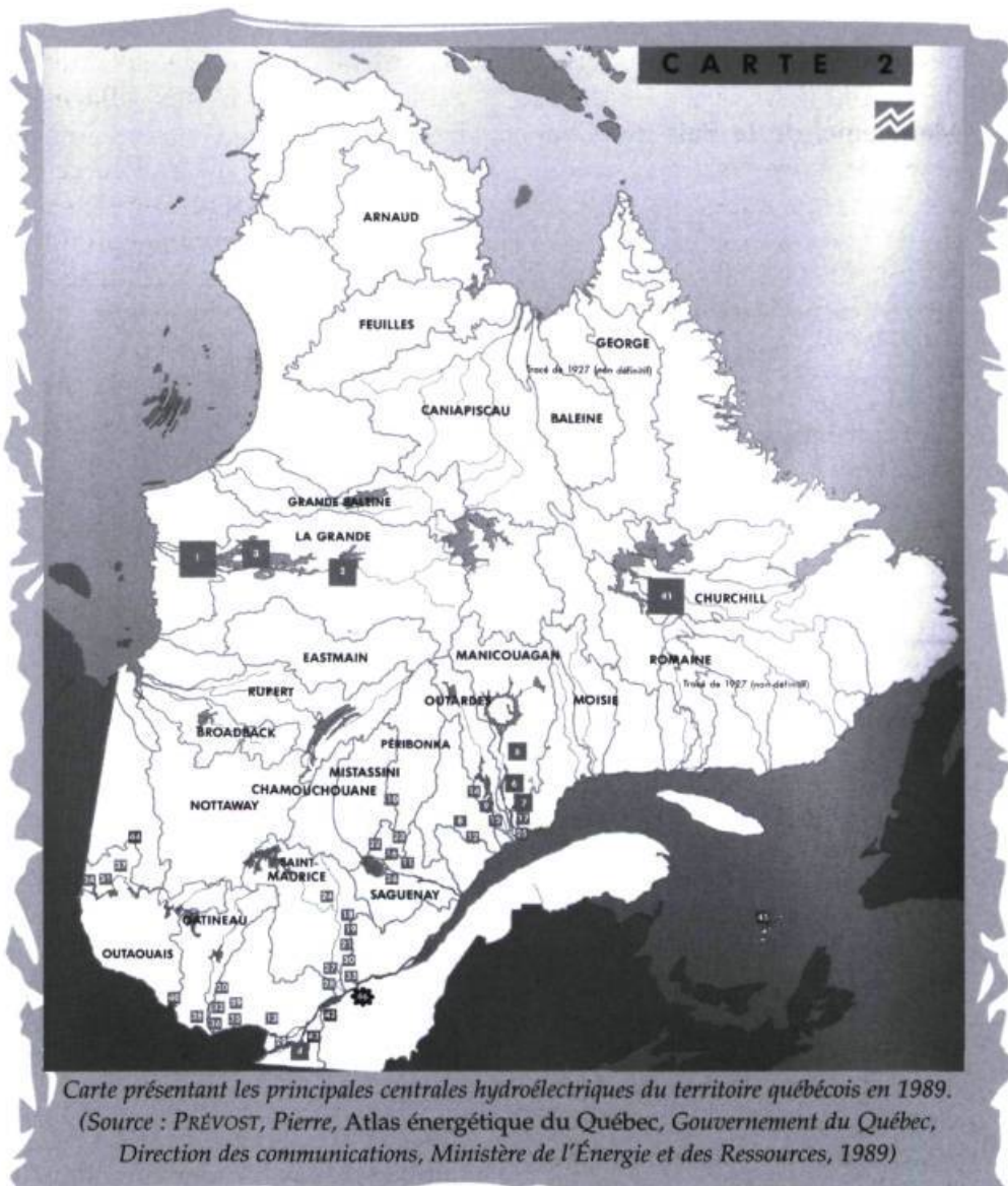
Carte présentant les principales centrales hydroélectriques du territoire québécois en 1989.

Plusieurs des employés arrivent des villages voisins de la Haute-Côte-Nord et du Saguenay. Les fermiers-bûcherons troquent la